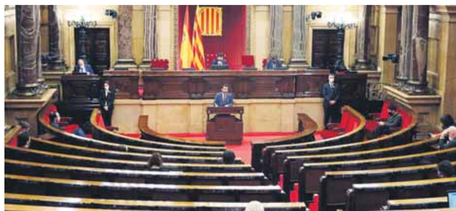
L'últim ple de la legislatura passada, al desembre, amb l'hemicicle pràcticament buit

■ La mesa autoritza que en els ordinaris hi participin fins a la meitat dels diputats ■ El primer serà la setmana vinent