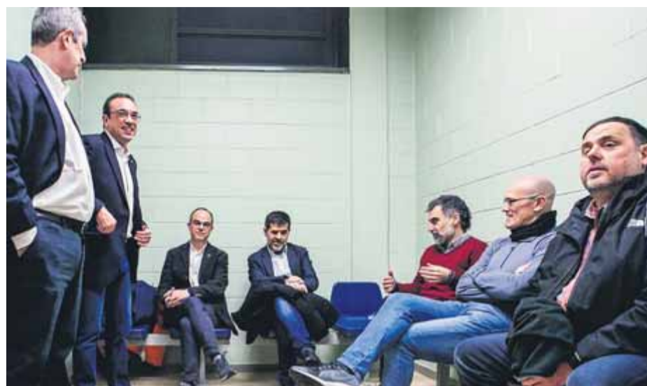
Els set presos polítics esperant a Lledoners per ser traslladats a Madrid, el 2019

L'exconseller de Justícia Carles Mundó també presentarà un recurs al Tribunal Europeu dels Drets Humans (TEDH) contra la seva condemna,