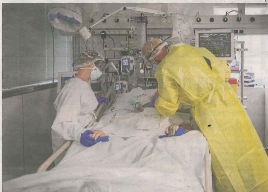
Dos sanitaris atenen un pacient amb Covid a l'UCI de l'hospital Clínic de Barcelona.

La bona notícia per a Prats és que l'augment de contagis està sent "suau".