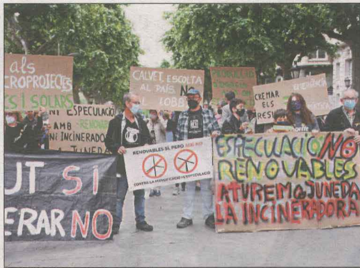
Una imatge de la protesta a Francesc Macià