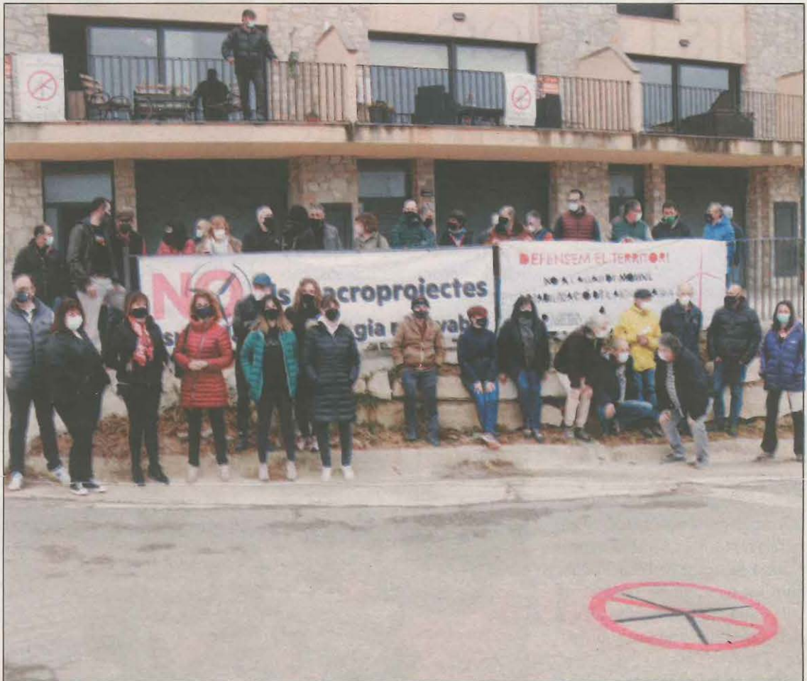
Imatge d'una de les concentracions que va tenir lloc a la Segarra en contra dels macroparcs

Morron explica que hi ha projectes d'inversos de Suïssa, Alemanya, Estat Units, Xina o Noruega entre altres països que han apostat per Catalunya perquè els genera confiança. Però si aquesta confiança es perd no tindran problemes en anar-se'n a qualsevol altre indret. En aquest sentit afirma que la inversió en energia eòlica un cop feta no és deslocalitzable. "Els beneficis i els llocs de treball es quedaran aquí mentre duri la vida útil de les centrals eòliques" afirma. El gerent recorda que a Catalunya hi ha actualment sobre la taula projectes que suposarien uns 6.600 megawatts d'energia i que aquest és el camí que s'ha de seguir cap a un canvi de model i també cap a la sobirania energètica que necessita el país.