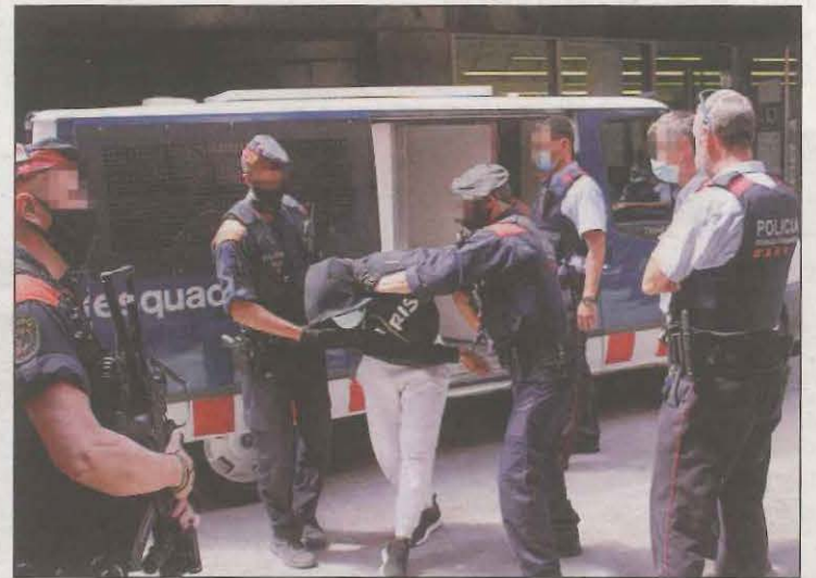
Un dels detinguts en l'operatiu policial

Les mateixes fonts també apunten que la investigació s'ha estès a altres comunitats de l'estat espanyol. En l'operatiu es van detenir 16 persones, 13 de les quals estan en presó provisional i sense fiança, mentre les altres 3 han quedat en llibertat provisional amb mesures cautelars. Cal recordar, tal com va informar aquest diari, que el jut-