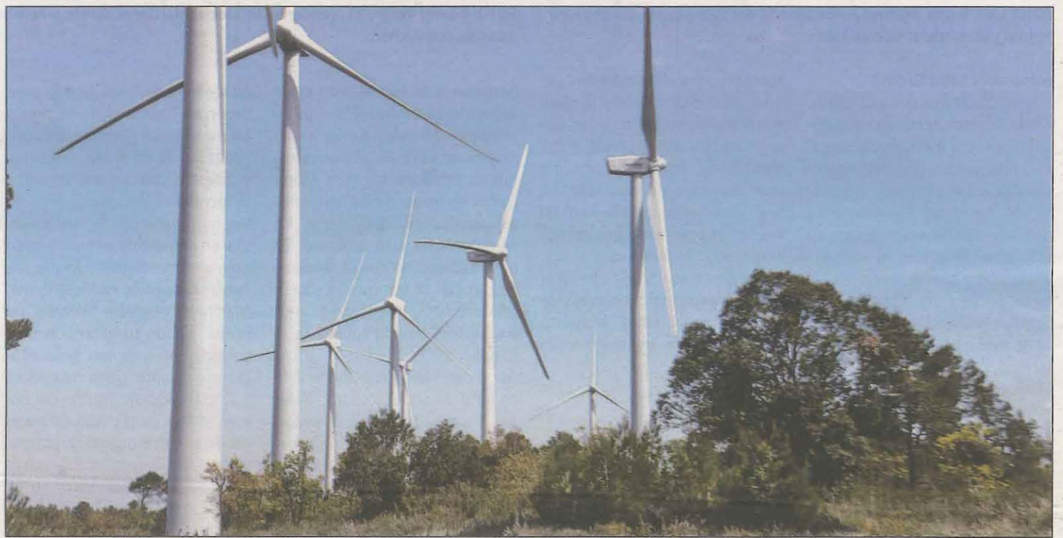
Els parcs que han rebut la viabilitat de la Ponència no tenen garantida al cent per cent la seva construcció final