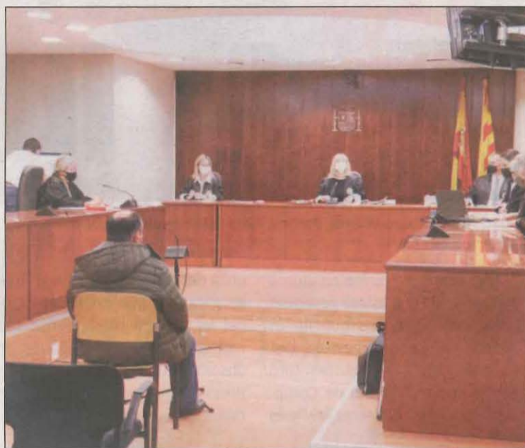
Moment del judici que es va fer a l'Audiència de Lleida

Tot i que la Fiscalia demanava 8 anys i 9 mesos de presó per un delictes continuat d'abús sexual i 3 anys més per haver obtingut relacions sexuals amb una persona amb discapacitat a canvi de diners, finalment l'Audiència ha condemnat l'home a 3 anys i mig de presó per un delictes d'abús sexual en grau de temptativa i a 2 anys i 8 mesos de presó per corrupció d'una persona amb disca-