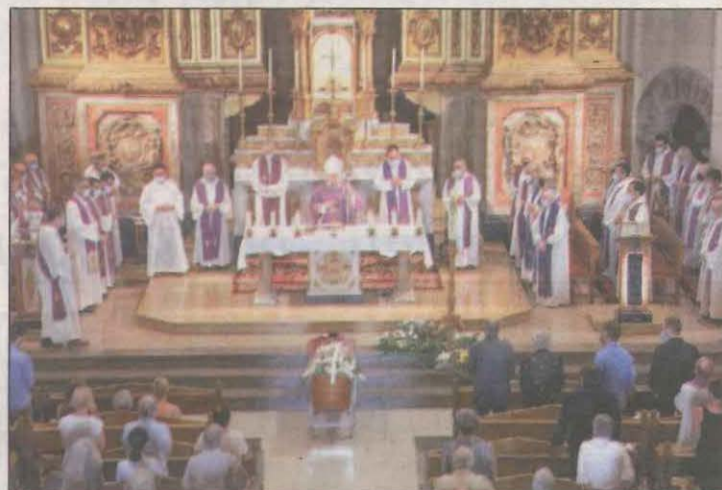
Moment del funeral celebrat ahir a Tremp

venció de salut psicoemocional destinat a aquest col·lectiu a través de l'Oficina Jove. Així, també es vol que aquest tingui una vessant formativa i sensibilitzadora adreçada a les escoles. Des de la formació consideren que arran de la crisi sanitària s'ha agreujat "dràsticament" la problemàtica dels trastorns mentals que ja existia a la ciutat.