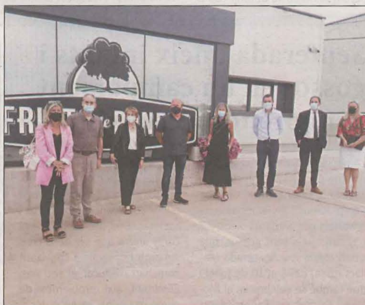
Tàrrrega va acollir ahir la presentació de l'informe del 2020