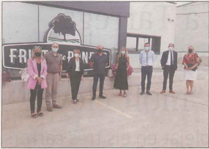
Lienas va visitar Fruits de Ponent, on tenen pla d'igualtat