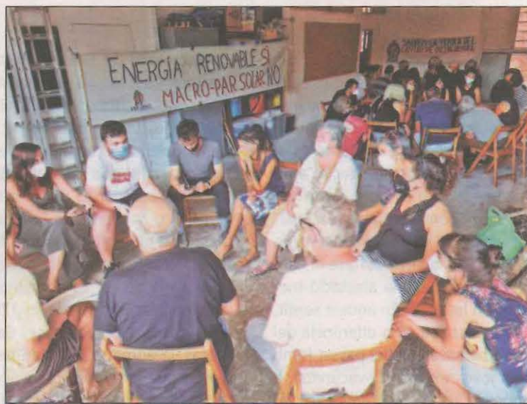
FOTO: ACN / Assemblea de la Plataforma contra l'Autopista Elèctrica

Ara, els contraris a aquest projecte han dit que es posen a treballar de manera immediata en la recollida d'al·legacions contraries a aquest projecte atès que el període d'al·legacions acaba les properes setmanes. Pel que fa a la marxa lenta que anirà del port de Comiols fins a Tremp, serà la primera de les accions que prepara la Plataforma unitària contra aquest projecte.