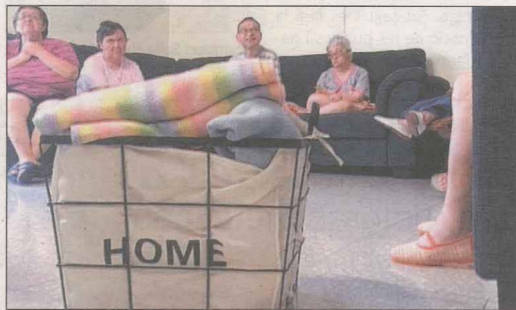
El projecte neix de la necessitat detectada a la comarca

La cooperativa Alba Jussà oferirà un servei d'habitatge i acompanyament a la vida independent per a persones amb discapacitat intel·lectual al Pallars Jussà. Aquest servei arrencarà a partir del gener del 2022 a la Pobla de Segur. Es tracta d'un equipament públic d'acolliment residencial, de caràcter temporal o permanent, adreçat a persones amb un grau de discapacitat intel·lectual igual o superior al 33% i que necessiten la provisió d'un servei amb suport de caràcter residencial. Seran dos pisos amb habitacions individuals i jardí que es convertiran en una casa adaptada i amb suport per les persones que vulguin anar-hi a viure. Tindrà una cabuda per atendre a sis