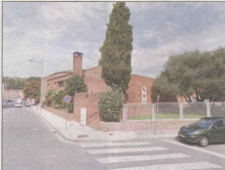
La llar d'infants El Patufet de la capital de la Noguera