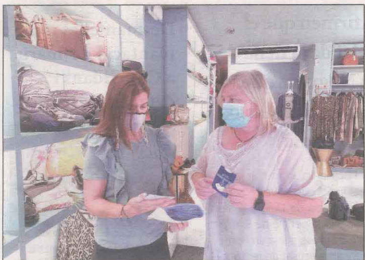
Són per les zones amb limitació horària