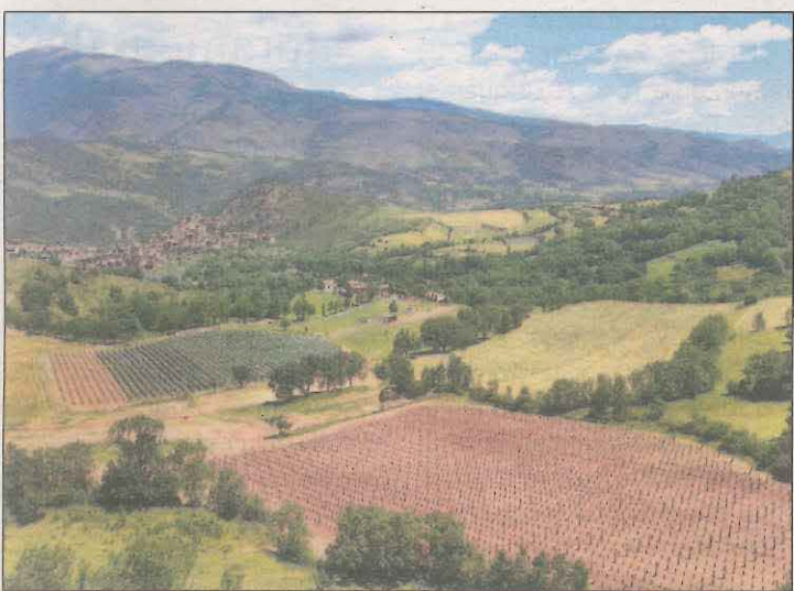
És un vi blanc del qual se n'han embotellat 1.200 ampolles

Precisament, ahir el regidor de Junts, Guifré Ricart, va exposar aquest tema a Ràdio Balaguer, des d'on criticava que des de la Paeria no s'hagués fet cap campanya per incentivar que hi hagi més inscrits. Per la seva banda, el Paer en Cap va remarcar que "creiem en els serveis públics".