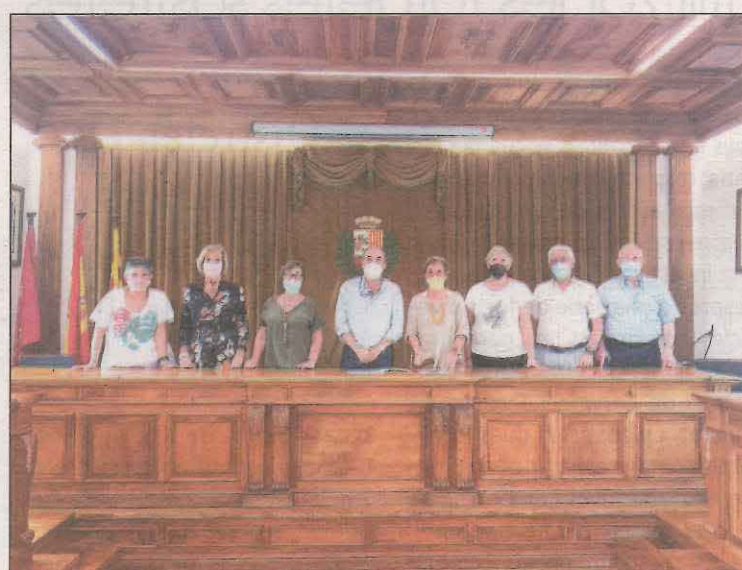
El conveni comporta una partida de 20.000 euros

L'Ajuntament de Vielha e Mijaran ha renovat el conveni de col·laboració amb la junta de la llar del jubilat "Sant Miquèu" de Vielha. Una col·laboració que va acompanyada d'una partida de 20.000 euros amb la qual el consistori pretén continuar ajudant a la junta d'aquesta instal·lació municipal perquè pugui preparar i desenvolupar el programa d'activitats anuals.