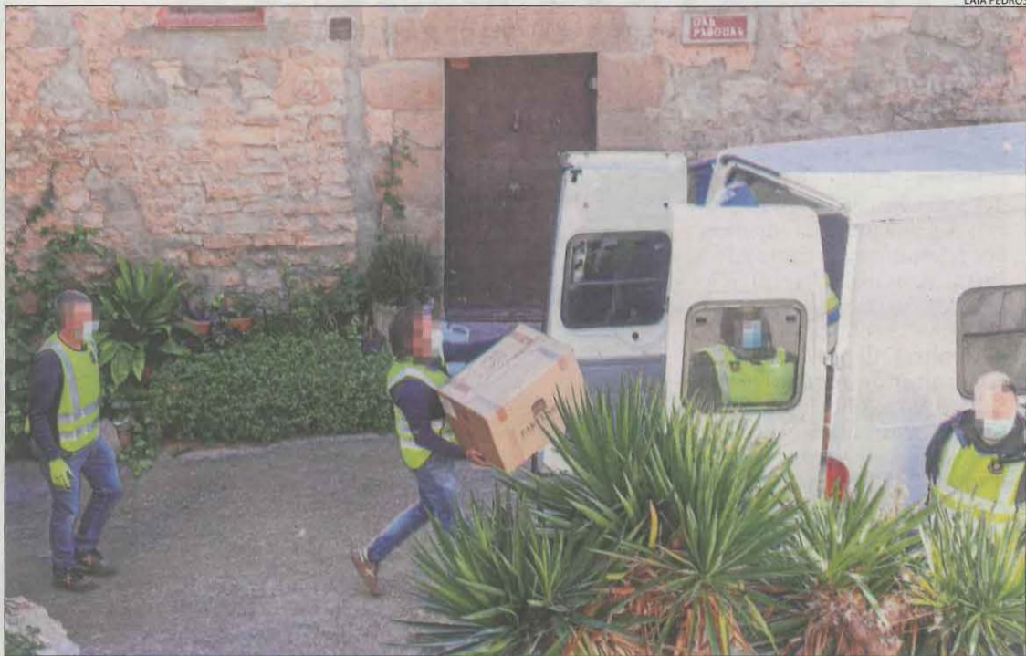
Més d'una desena d'agents van participar ahir al matí en la batuda.

La investigació continua oberta i tot apunta que hi haurà més detencions. L'arrestada declararà aviat davant del jutjat d'instrucció en funcions de guàrdia de Cervera.