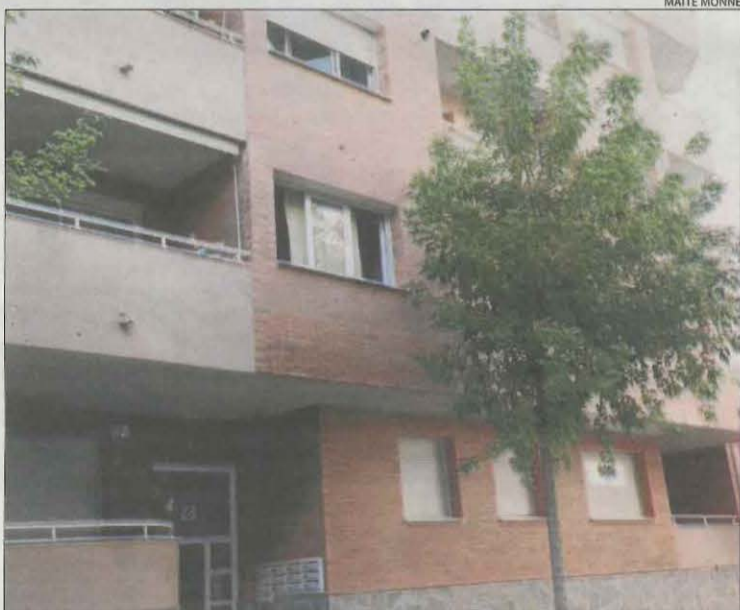
Imatge de l'immoble afectat pel foc a Alcarràs.