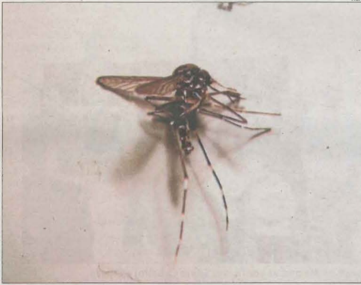
El mosquit tigre té una línia característica al cap i al tòrax.

Segons els experts d'aquest projecte, "les densitats de mosquit tigre s'expliquen sempre per dos factors: el clima i la conducta humana, ambdós són els que els proporcionen periòdicament punts amb ai-