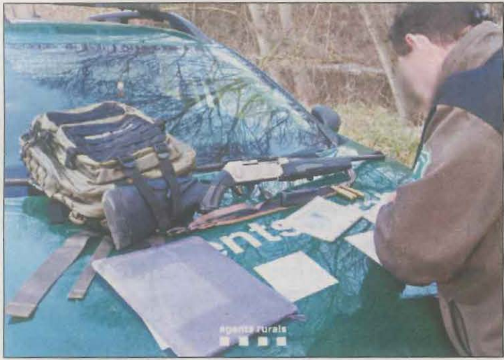
La sanció es va produir al Pallars Jussà