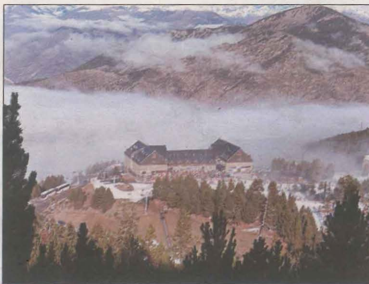
Un establiment hotelier del Pirineu de Lleida

L'any 2019, juntament amb el 2018 i també el 2006, es mantien fins ara com els tres millors registres quant a ocupació turística a la demarcació de Lleida. Si bé tots els subsectors d'allotjament turístic han millorat els seus resultats d'abans de la pandèmia, els sectors de turisme rural i càmping han assolit un creixement espectacular, del 31 % en pernoctacions els càmpings i del 28 % el turisme rural, així com un altre 9,7 % en els apartaments