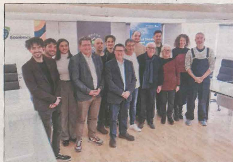
Un moment de la presentació de la campanya

La plaça on s'ubica, les parets de les antigues Escoles Velles es