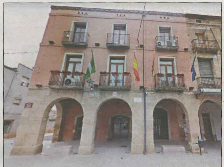
Imatge de la façana de l'ajuntament d'Almacelles

ra el mateix afectat, el febrer de 2021, l'ajuntament va tornar a nomenar sense cap procés de promoció interna al seu predecessor, que suposadament continuava incomplint els requisits, per davant altres agents que sí que els complien. Un cop superat el període de pràctiques, i nomenant el funcionari de carrera l'agost de 2021, l'Ajuntament el va ratificar el març