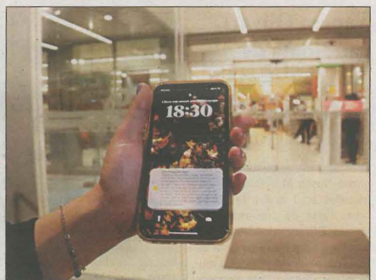
Una dona mostra un missatge rebut en el mòbil