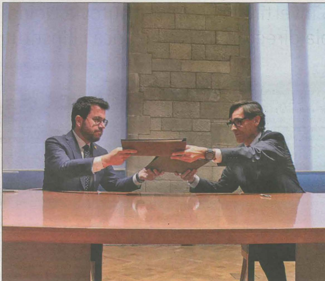
El president Aragonès i Salvador Illa van signar ahir el pacte dels pressupostos a la Generalitat

També preveu una inversió, fins el 2026, de 49 MEUR per Delta de Llobregat per assolir un espai natural i amb biodiversitat