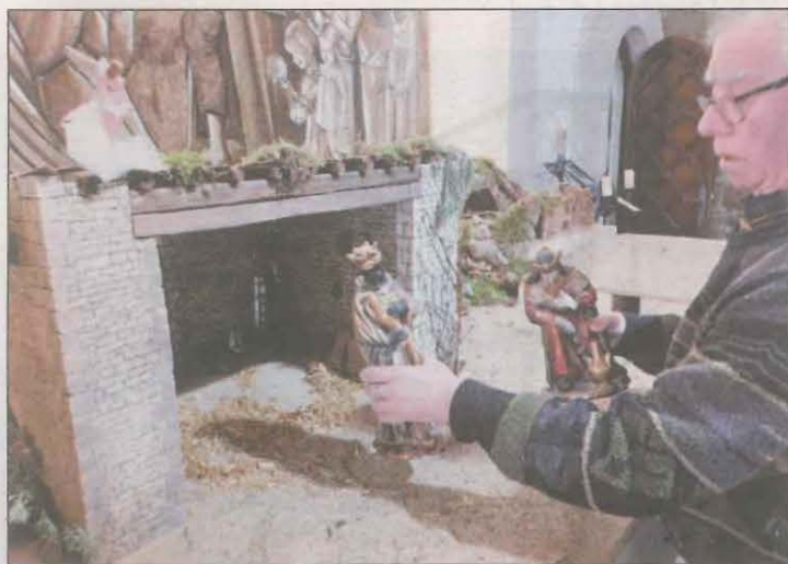
Un mestre pessebrista desmunta el seu pessebre