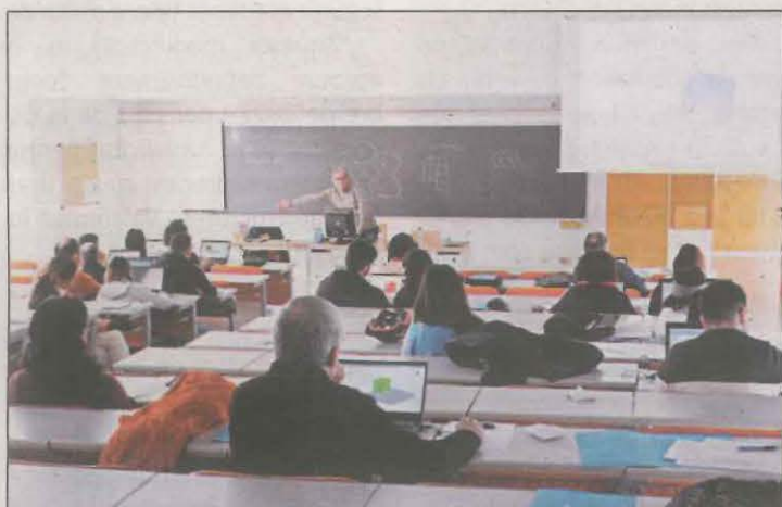
Un taller de matemàtiques a la UdL