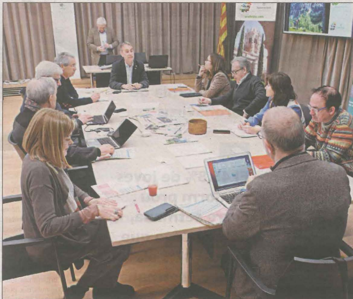
Els membres del jurat del 'Pica d'Estats' durant la seva reunió de deliberació

A més, l'espai televisiu Food Safari Catalunya chapter 1 , del