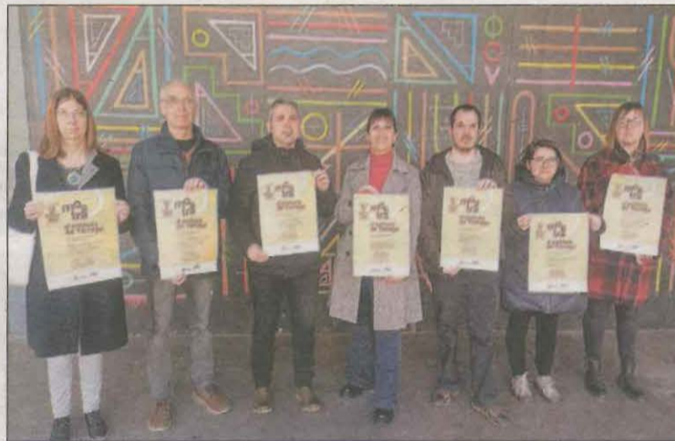
Presentació de la Mostra d'Entitats i el cartell

Tàrrega ja va celebrar amb èxit una primera Mostra d'Entitats el 2008 al Parc de Sant Eloi, a la qual van seguir unes altres tres edicions consecutives a la plaça de les Nacions sense Estat fins al 2011. "Ara que hem superat la pandèmia, és un bon moment per reprendre la trobada on els col·lectius targarins podran exhibir les seves potencialitats al conjunt de la ciutadania", afirmen des de l'organització. A més d'estands i parades, també s'oferirà un ampli ventall d'activitats