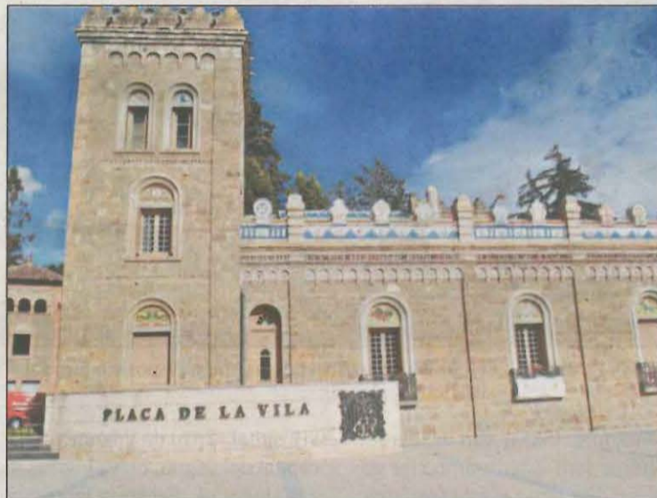
Imatge de la Pobla de Segur, al Pallars Jussà

Les persones que vulguin participar podran emetre la seva preferència en una urna a la sala de plens de l'Ajuntament de la Pobla. La consulta proposa als veïns que respecte a la proposta de canvi de nom de l'actual passeig Josep Borrell, s'han de pronunciar sobre si volen mantenir el nom actual de