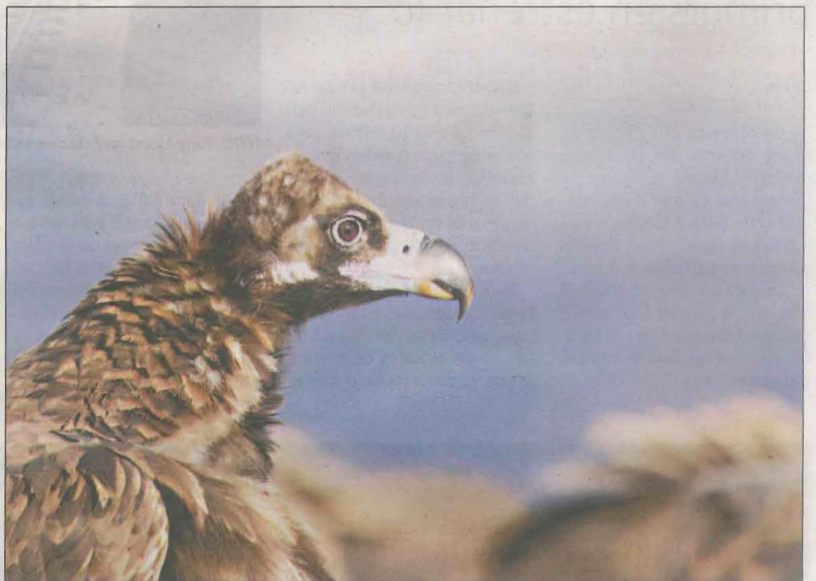
Imatge d'un voltor negre, una espècie que està en perill de desaparèixer

La Reserva Nacional de Caça de Boumort és el centre neuràlgic de la reintroducció de l'espècie als Pirineus. Dels 65 individus observats aquest any, 23 han estat reintroduïts, 28 han nascut a la colònia i els altres són d'origen