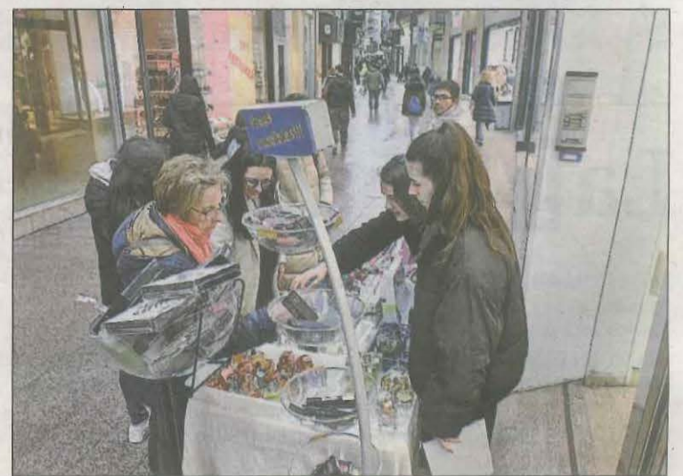
La pluja va restar compradors a les parades

nin sortida als estocs i els clients puguin comprar a preus reduïts. La Paeria dona suport a totes les iniciatives de les associacions de comerciants que participen en aquest Mercat de les Rebaixes. L'objectiu principal d'aquesta edició és acabar l'estoc de botigues i ajudar que el comerç es recuperi de la pandèmia. Com a novetat, també s'inclouen parades d'alimentació del Mercat de l'Hort.