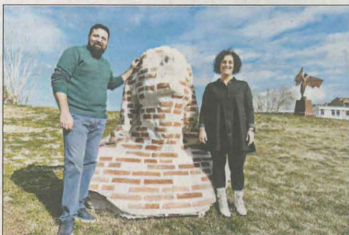
Una de les obres que s'exposaran