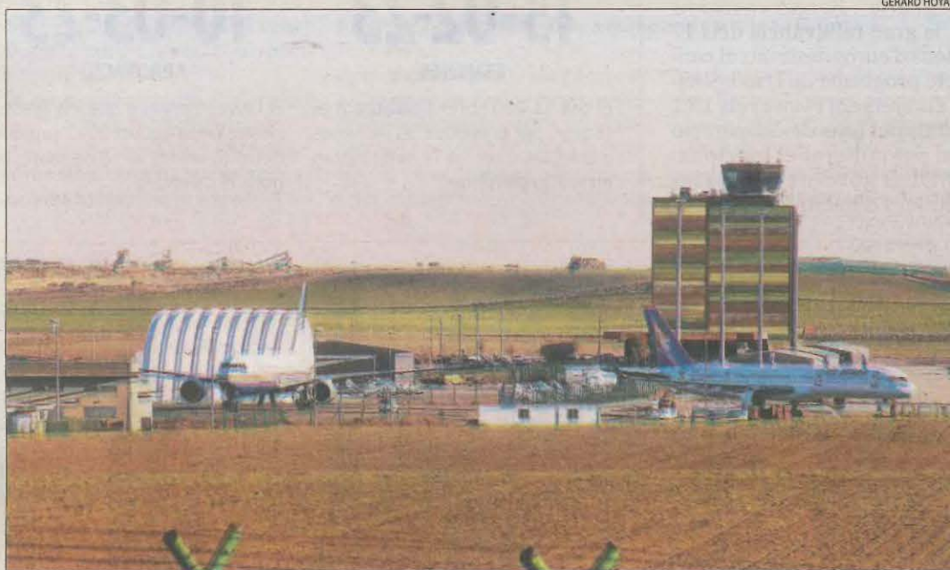
L'aeroport d'Alguaire, que rebrà una inversió de més de 5 milions d'euros.

■ Inversió de 176.000 euros per millorar la xarxa viària per a la prevenció d'incendis a la Cerdanya lleidatana. També hi ha 700 euros d'Infraestructures per a Gósol (Berguedà).