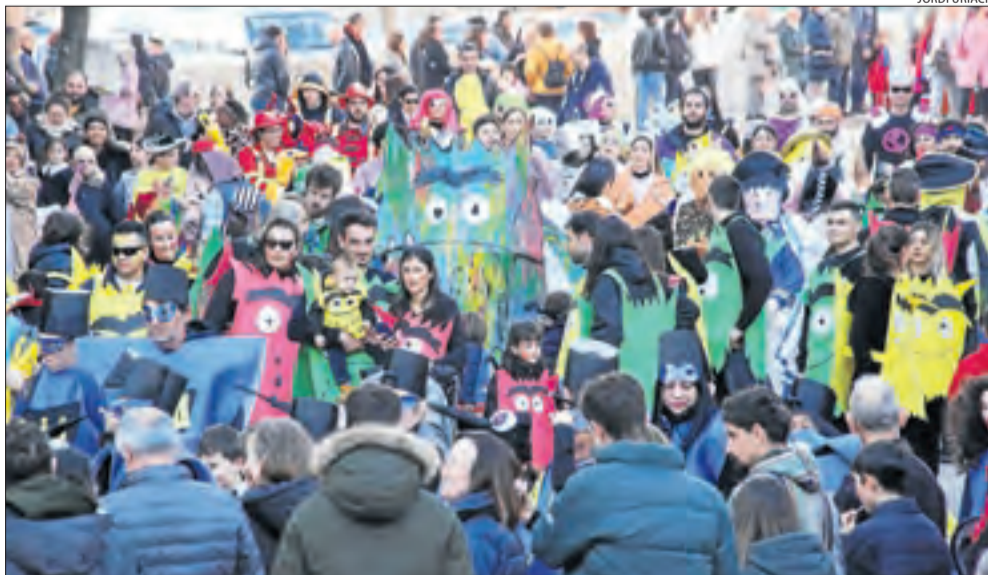
Tremp. Petits i grans van gaudir de la rua de Carnaval a la capital del Pallars Jussà. Famílies, col·legis i grups d'amics van sortir disfressats per participar en la desfilada.