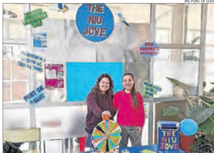
INS PONT DE SUERT