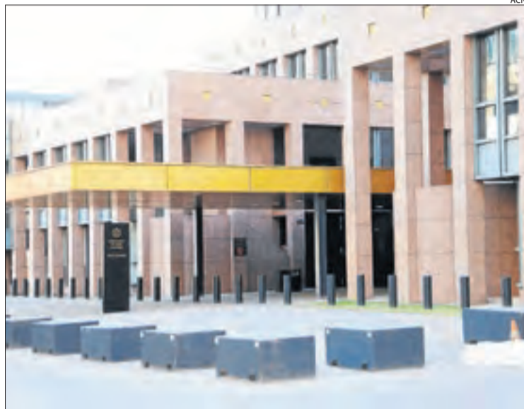
Vista del Tribunal de Justícia de la Unió Europea, a Luxemburg.

En cas de declarar-se nuls els acomiadaments, s'hauria de re-