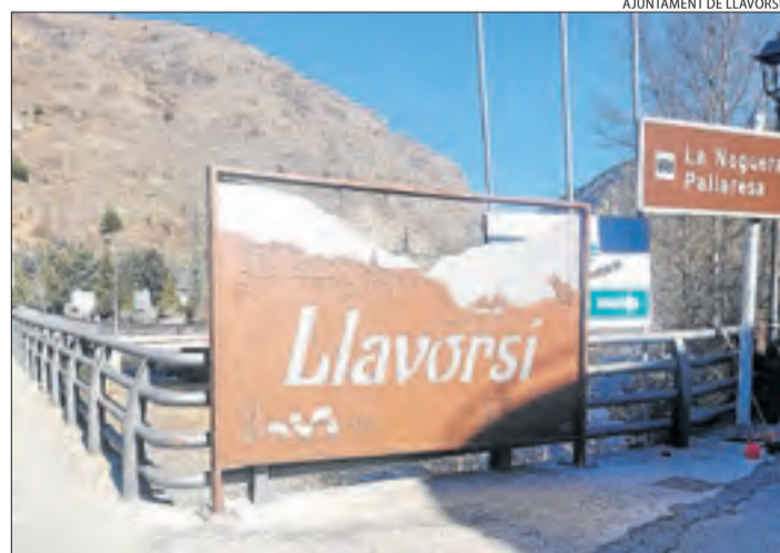
AJUNTAMENT DE LLAVORSI