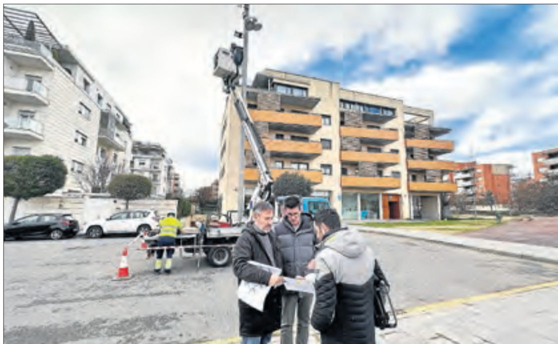
Una de les zones en les quals es millora l'enllumenat.

El robatori d'aquest tipus de cablatge és relativament freqüent a la ciutat. Per exemple, ha ocorregut en zones com el bosc urbà de Magraners i a l'en-