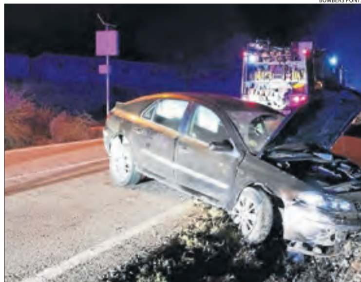
Vista del vehicle accidentat dissabte a la nit a Gualter.

D'altra banda, sobre la una de la matinada, els Bombers van ser alertats per un accident al carrer Canal d'Urgell de Montoliu de Lleida. A l'arribar al lloc, van trobar un vehicle