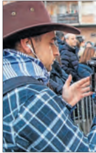
Els companys de Lleida TV van