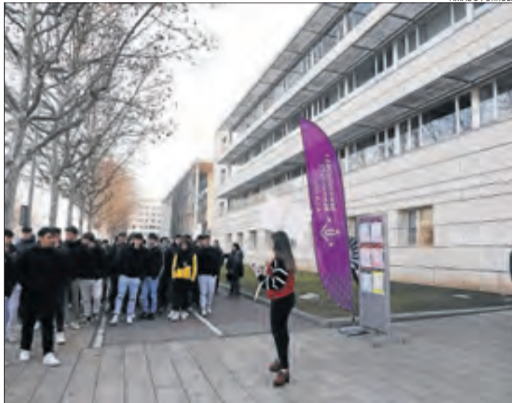
Alumnes a la jornada de campus oberts de la UdL.

De fet, hi ha més estudiants d'origen estranger, 447 segons va informar recentment la mateixa UdL, i també de Tarragona (706) i de Barcelona (1.112, a què en cal sumar 444 de la comarca de l'Anoia). De Girona n'hi ha menys, 165, i de la resta de l'Estat, 1.683.