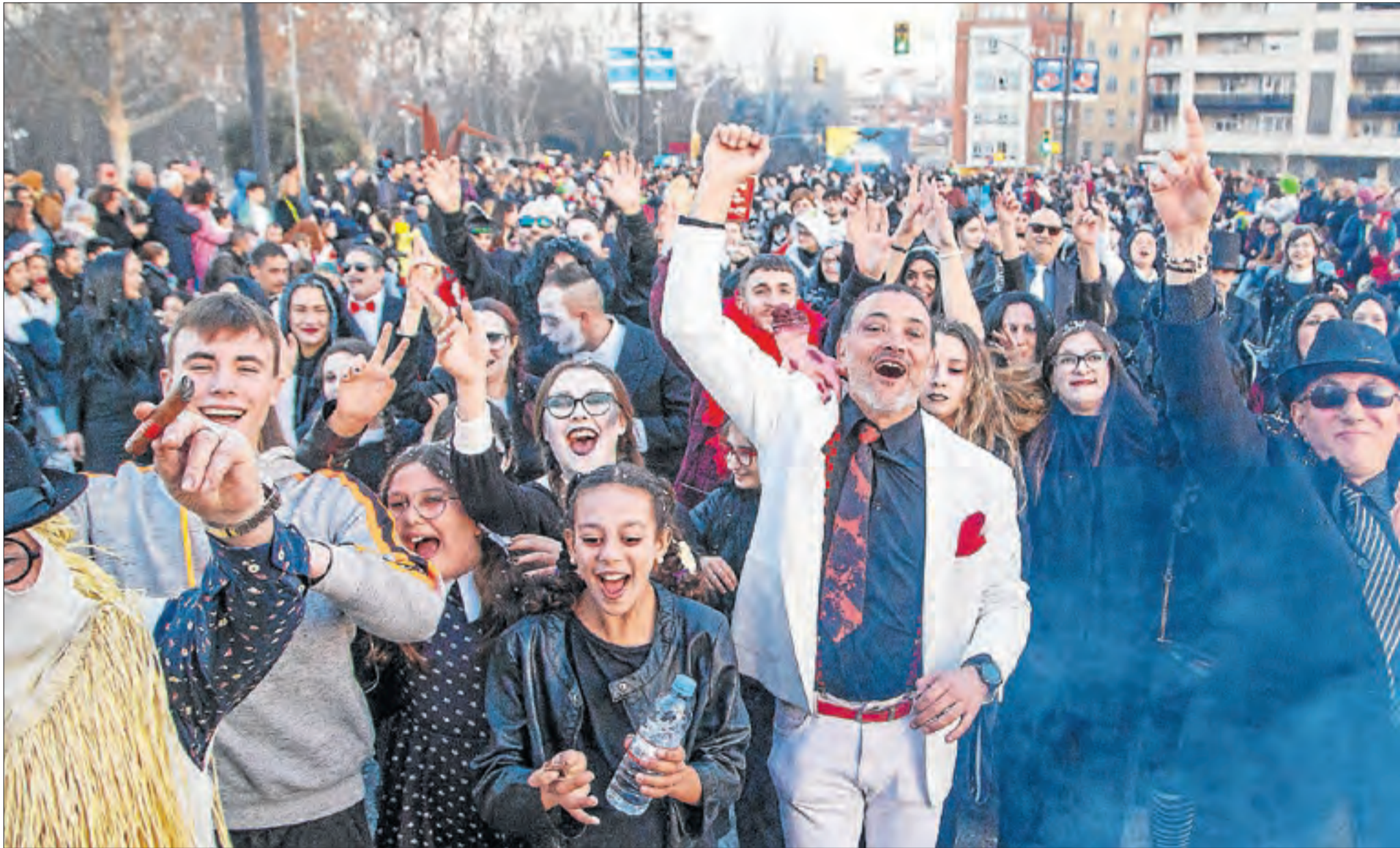
La música i la festa van ser les protagonistes als carrers de la capital del Segrià durant tota la tarda amb la vistosa rua que va congreguar milers de persones.