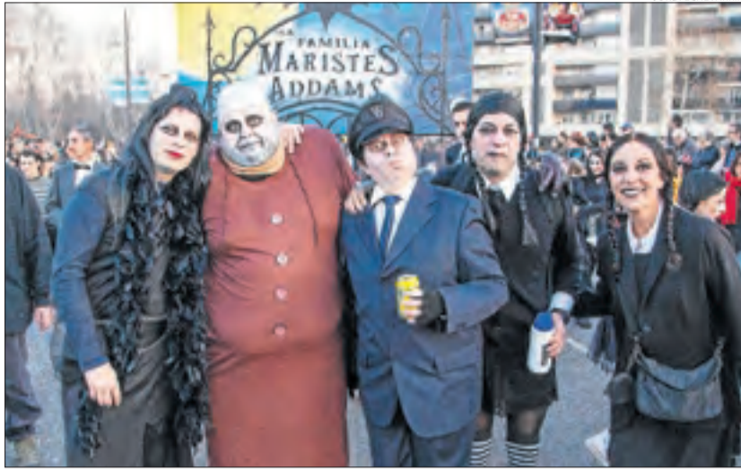
La família Addams al complet, ahir a Lleida.