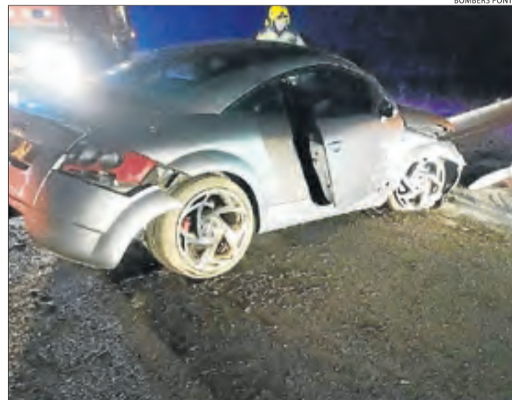
Un altre vehicle va sortir de la via de matinada a Oliola.

Finalment, a Rialp es va produir una col·lisió per encaix entre dos vehicles al punt quilomètric 132 de la C-13. Els serveis d'emergències van rebre l'avís a les 14.41 hores, però cap