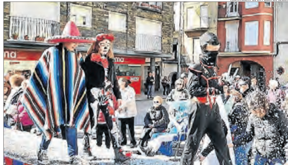
La Pobla de Segur. Disfresses de mexicans, de lluitadors asiàtics i fins i tot de personatges de videojocs van ser les que van poder veure's a la festa de la Pobla de Segur.