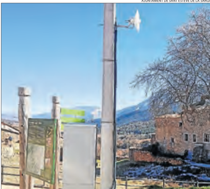
AJUNTAMENT DE SANT ESTEVE DE LA SARGA

| SANT ESTEVE DE LA SARGA | La fibra òptica arribarà als veïns de Sant Esteve de la Sarga a través de l'Observatori Astronòmic del Montsec, l'únic edifici que en té al municipi. Un acord entre l'ajuntament i l'Institut d'Estudis Espacials de Catalunya (IEEC), gestor del complex científic, permetrà que aquest comparteixi el seu accés a internet de banda ampla mitjançant antenes repetidores en cadascun dels deu