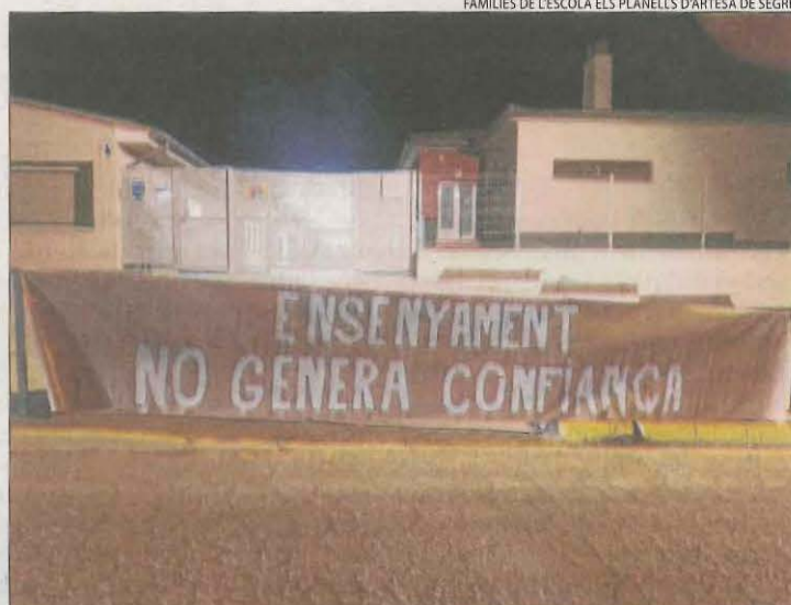
FAMÍLIES DE L'ESCOLA ELS PLANELLS D'ARTESA DE SEGRE

Els pares van apuntar que continuen rebutjant el professor, que la setmana passada sí que va assistir al centre, tot i que no va exercir com a docent. Inicialment va ser nomenat tutor d'un dels grups d'I-3, malgrat que fins a la data no ha exercit com a tal i mai en solitari. Sempre ha estat acompanyat a les aules del cicle infantil del col·legi. Fonts properes van apuntar que el professor va estar tota la setmana passada a la biblioteca. "No sabem quina solució ens oferirà Educació però no volem aquest docent al col·legi. Si dilluns vinent 27