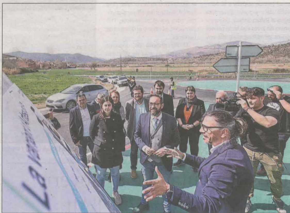
Posada en funcionament ahir de la variant d'Artesa de Segre

El projecte del tram que uneix el nucli de Folquer i Isona i Conca Dellà (Pallars Jussà) es lliurarà durant el quart trimestre d'enguany. Això permetrà donar un impuls a aquesta actuació. De fet, ahir divendres va entrar en servei la variant d'Artesa de Segre (Noguera), d'1,1 quilòmetres. La previsió és que aquest estiu es licitin obres entre els nuclis del Pont d'Alentorn i Vall-llebrera. Al segon semestre de 2024 es farà el mateix des d'aquest punt i fins a Folquer. Pel tram comprès entre el nucli de Folquer, a Artesa de Segre, i Isona i Conca Dellà, s'estima una inversió de 129 milions d'euros, tenint en compte que és el més complex de tot l'Eix, ja que és punt on hi ha el Coll de Comiols. En aquests 13,3 quilòmetres de la C-1412b es farà una actuació més "contudent", tot incloent-hi túnels i viaductes. Pel que fa als 15 quilòmetres que separen Artesa de Segre i Folquer, els treballs consistiran en condi-