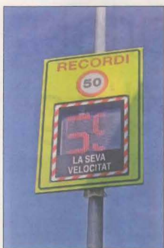
Senyal a la C-14 al seu pas per Agramunt