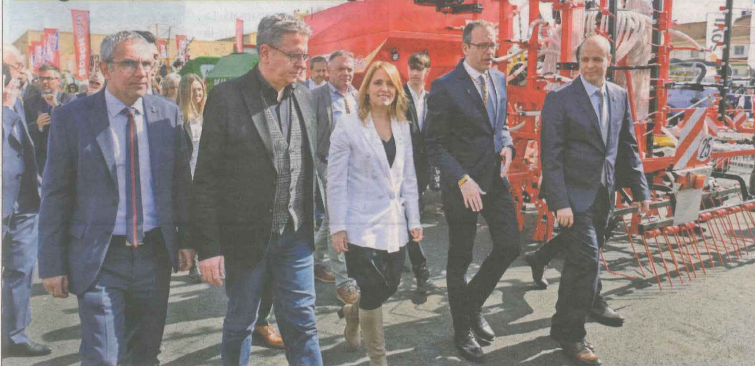
La 'consellera' de Economia, Natàlia Mas, inauguró ayer el 150 aniversario de la Fira de Sant Josep de Mollerussa