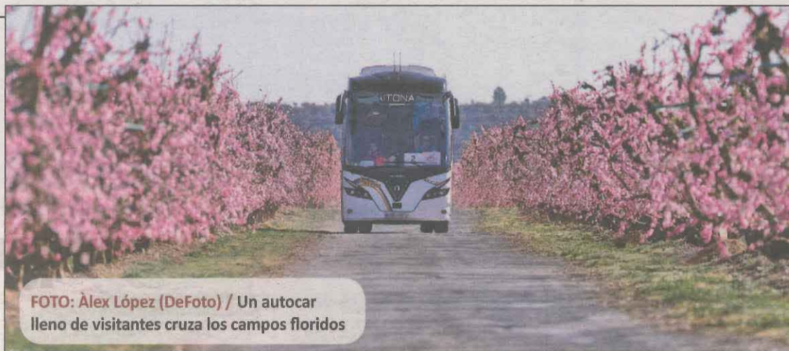
Un autocar lleno de visitantes cruza los campos floridos