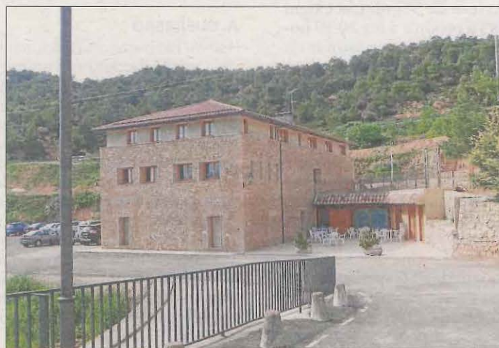
Imatge d'arxiu de l'edifici del Sindicat de Tarrés.

Aquest concurs, que es tancarà a començaments del mes