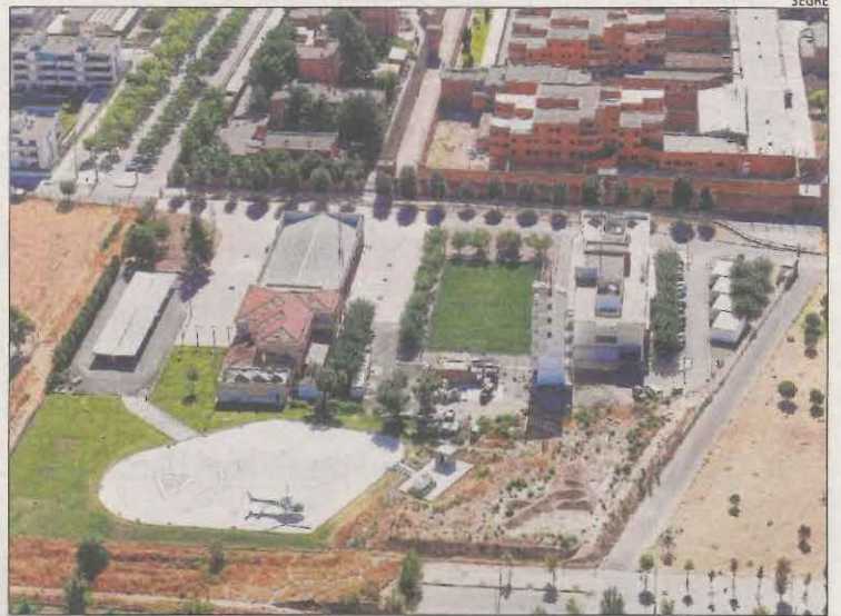
Vista aèria del parc de Bombers de Lleida.

Per la seua banda, des de la direcció general de Prevenció, Extinció d'Incendis i Salvaments van declinar fer declaracions sobre aquesta qüestió. Fonts solvents expliquen que durant els últims cinc anys les hores extres han representat una despesa de 90 milions, amb sobreesos que suposen que un bomber percebi entre 10.000 i 30.000 euros més a l'any i la Sindicatura de Comptes ho està analitzant.