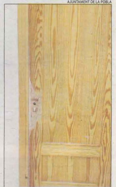
Una de les portes destrossades.

L'ajuntament va denunciar els robatoris als Mossos d'Esquadra, que van obrir una investigació. Els policies van inspeccionar els locals i van trobar empremtes del suposat autor. Des d'un primer moment, van sospitar que els saquejos van ser obra de la mateixa persona. Finalment, va poder ser identificat i va ser arrestat com a presumpte autor d'alguns de delictes de robatori amb força. La investigació ja està judicialitzada.