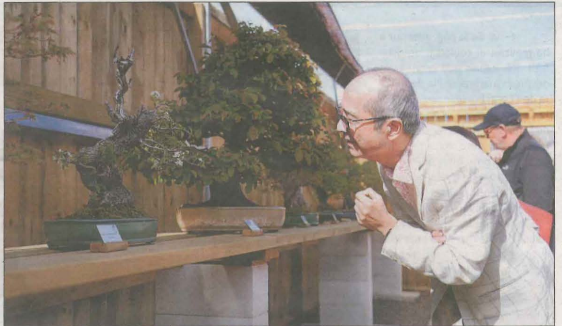
El cònsol general del Japó, Yasushi Sato, aprecia un dels bonsais del nou museu Espai Bonsai

El Carrer Doctora Castells, a Cappont, va ser ahir l'escenari del Vermut Musical Pot Fest i on diversos artistes van pintar cotxes amb motiu del festival d'art urbà.