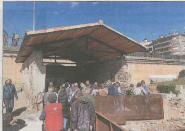
La rehabilitació de les adoberies es va inaugurar ahir

Les actuacions han tingut un pressupost total de 310.000€, aportats en un 41% per la Generalitat amb fons europeus FEDER, un 21% per la Diputació de Lleida i un 38% pel propi Ajuntament.