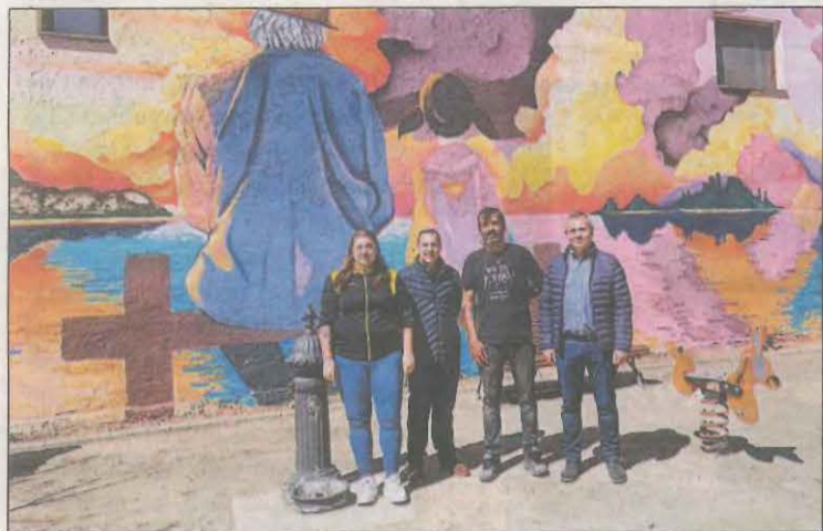
Artista i autoritats davant el mural