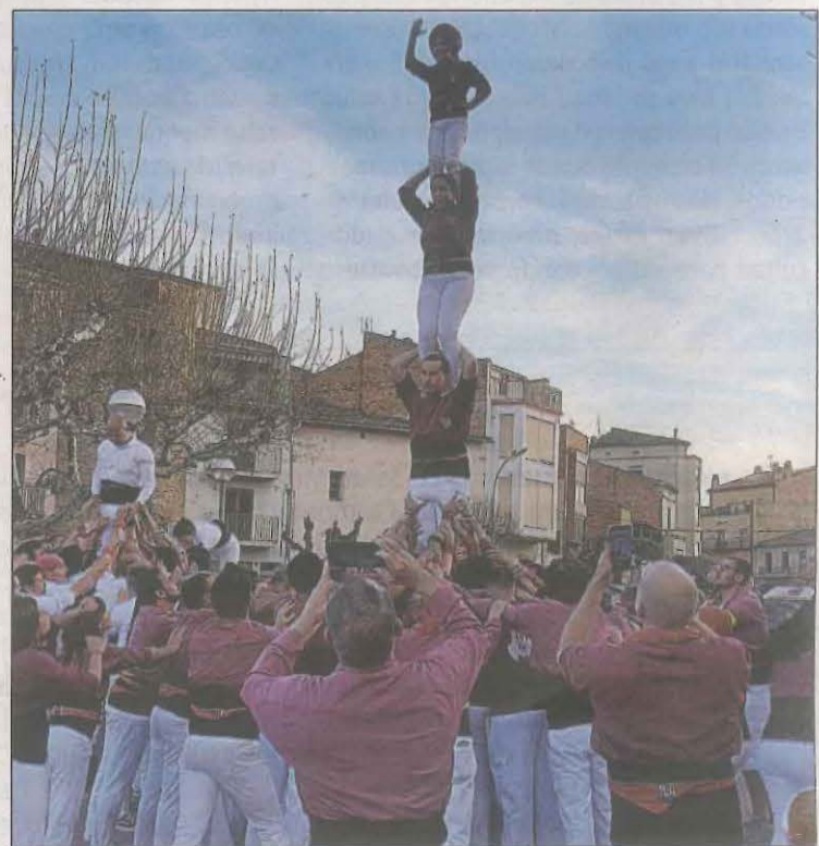
Les dues colles van acabar amb pilars de quatre

La colla vol recordar que assaja els dimecres de les vuit a les deu del vespre i els divendres de les nou a les onze de la nit al Carrer Lluís Besa, 7. Tothom és benvingut al local dels Castellers de Lleida per fer pinya amb la colla i ajudar-la a fer-la més gran.