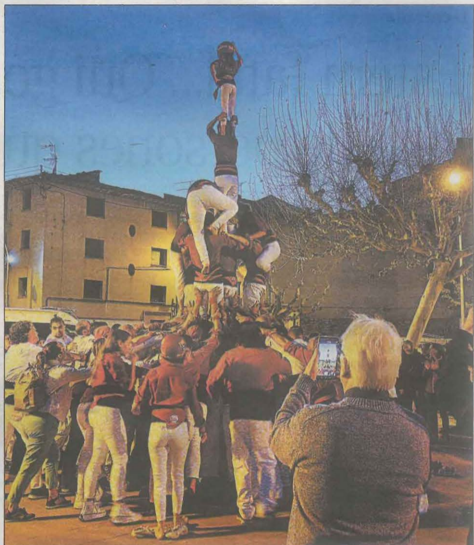
Dos dels castells que es van poder veure a la diada dels Malfargats del Pallars. A l'esquerra un 3d6 carregat i a la dreta un 3d6 amb agulla durant la seva construcció