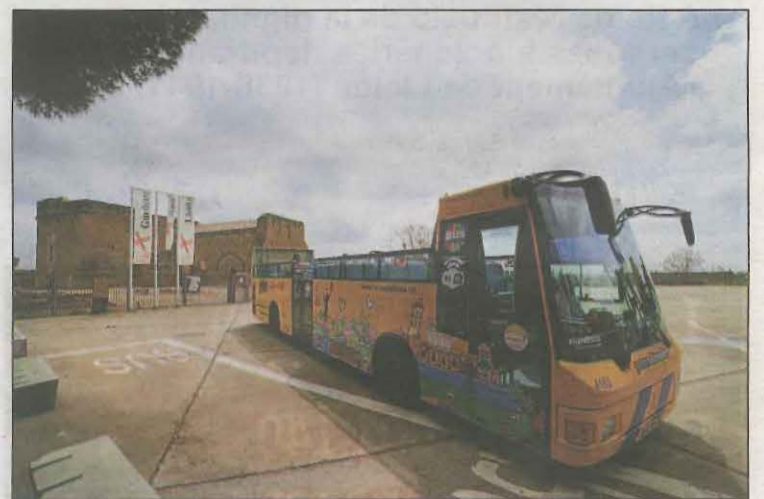
El bus turístic va començar a rodar de nou ahir

El bus turístic de la ciutat de Lleida va iniciar ahir la temporada. Com cada any, la Paeria, a través de Turisme de Lleida i Autobusos de Lleida, posa en marxa aquest servei que serà operatiu diàriament fins al 9 d'abril i a partir d'aquesta data funcionarà els caps de setmana de primavera i els festius 1 i 11 de maig.