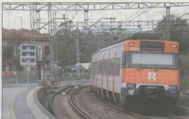
Els abonaments són per Rodalies i Mitjana Distància

Després que el Govern central aprovés el passat mes de desembre la gratuïtat dels abonaments per a 2023 per a viatgers recurrents, Renfe posa a disposició dels usuaris títols multiviatge específics que tenen vigència per a cada quadrimestre natural de l'any. Per agilitzar l'adquisició dels abonaments i evitar esperes innecessàries, l'adquisició dels abonaments és possible a través de l'aplicació de Cercanías de Renfe i, en el cas dels abonaments de Mitjana Distància, a través del web www.renfe.com i canals de venda habituals (estacions, màquines autoventa, etc.). Per