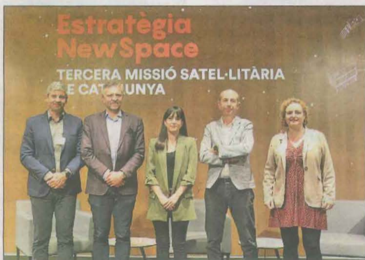
L'equip que va presentar ahir el projecte espacial

Cal recordar que ara és una època propícia per fer gelades, si bé els pagesos no temen que es pugui produir un fenomen semblant a la virulència del de l'any passat.