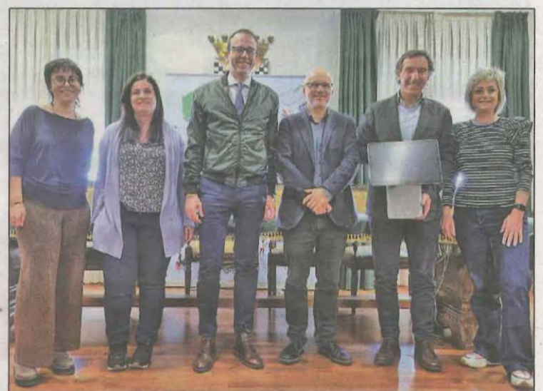
La iniciativa es va presentar ahir a Mollerussa