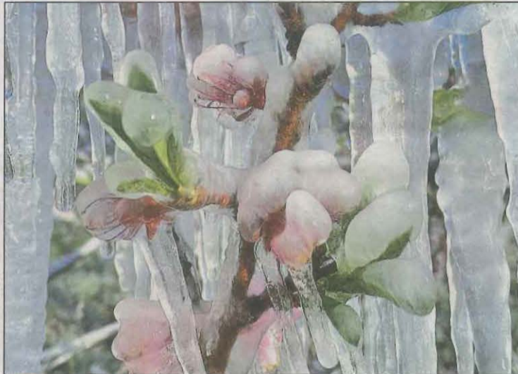
Fruits afectats per aquella gelada del 2022