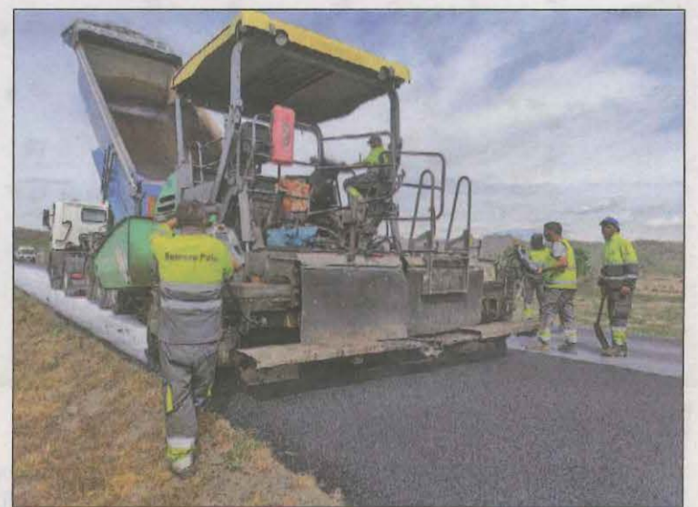
La prova es va dur a terme el passat divendres

El nou asfalt resultant, que aprofita subproductes de la indústria paperera, en concret de la paperera Alier de Rosselló, i que conté àrids siderúrgics, "és més resistent i té més durabilitat".