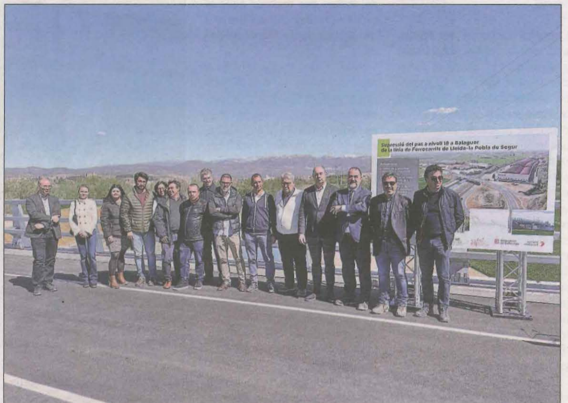
El nou pas elevat va ser inaugurat ahir per les autoritats

El nou pas superior s'ha dispostat mitjançant un pont de bigues