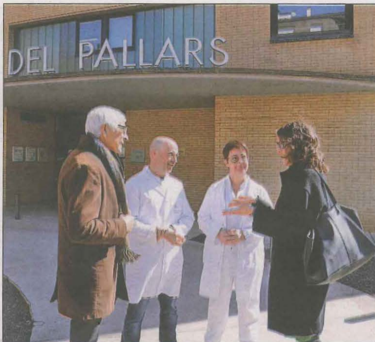
La nova prestació de l'hospital es va anunciar ahir