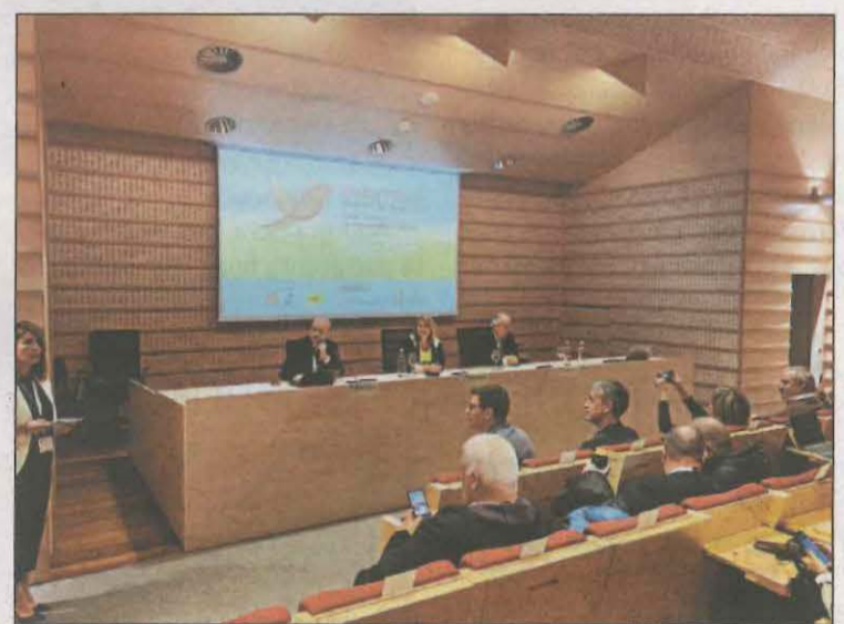
Un moment de la inauguració de la jornada