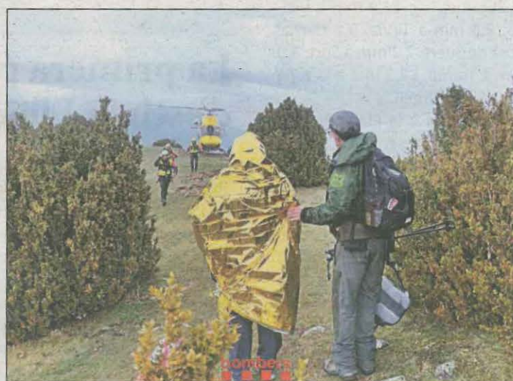
Moment del rescat del participant en la caminada