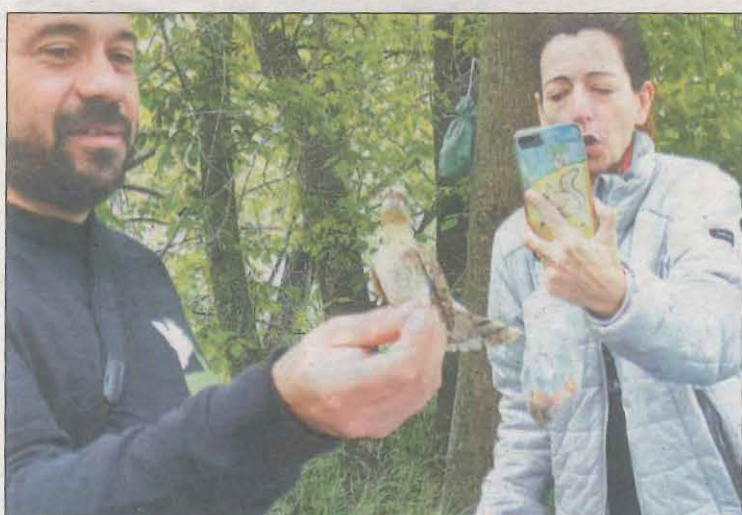
Un dels ocells que va ser anellat als Patamolls

Els Patamolls de Montoliu de Lleida van acollir ahir una activitat d'anellament d'ocells en la qual van participar diverses famílies que van gaudir de la diversitat d'aus que hi ha en aquest espai. De fet, es van trobar fins a deu espècies diferents, entre les quals hi havia el tallarol gros, el rossinol comú, la merla i el colltort.