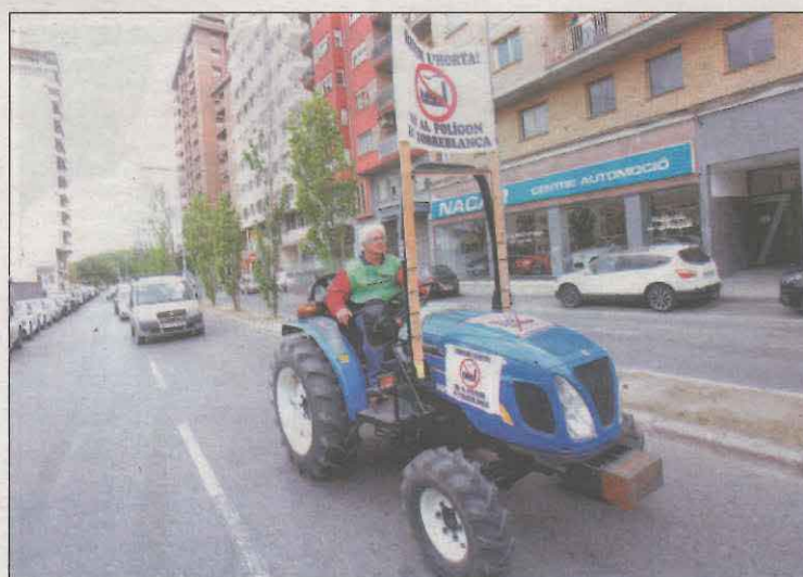
Un tractor encapçalava la caravana de vehicles

Veïns de Torres de Grealó i Quatre Pilans, la caravana va sortir cap a les 10.00 hores del barri de Magraners i va acabar als Camps Elisis. Així mateix, van lamentar que la Paeria "s'ompli la boca dient que protegeixen la marca Horta de Lleida quan realment la destruirà amb el macropolígon". A més, van anunciar que "aquesta no serà l'única marxa lenta que farem".