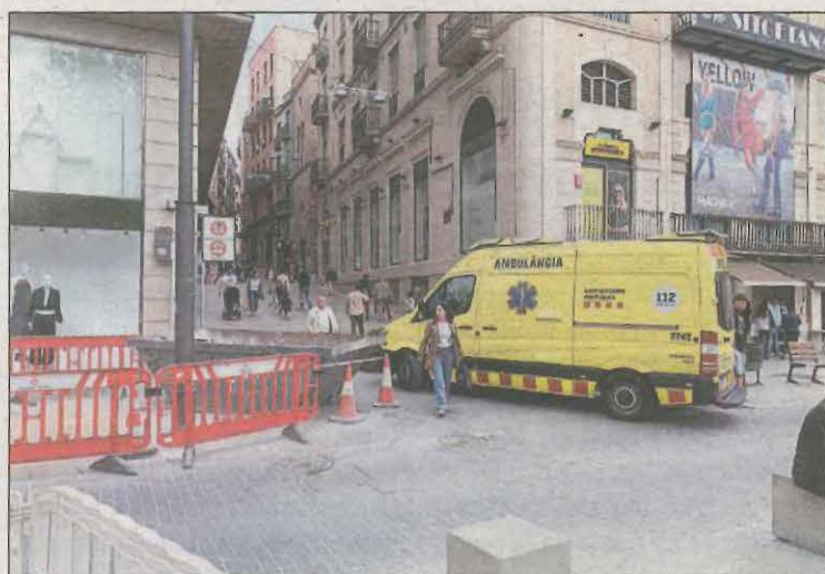
L'ambulància va aturar-se al Carrer Cavallers amb Blondel

Els facultatius del Sistema d'Emergències Mèdiques (SEM) van assistir ahir una dona que havia caigut a l'Eix Comercial, prop del Carrer Cavallers, i havia patit una possible fractura de genoll. Va succeir al matí i es dona que el cas que l'ambulància no va poder accedir al Carrer Major per les jardineres instal·lades.