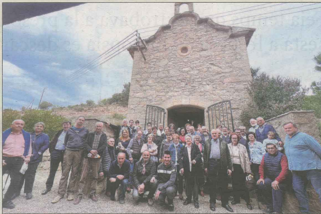
En el tradicional Aplec a l'ermita de la Mare de Déu dels Esclopets es va pregar perquè ploqui

Pel que fa a la Plana de Lleida, la pluja va ser força tímida, de manera local i en moments molt puntuals, sobretot entre les 16.00 hores i les 16.30 hores. Mostra d'això és que a la Granadella es van registrar 3,4 mm; a Raimat, 3,5 mm; a Gimennells, 2,6 mm; a Os de Balaguer, 2,6 mm, a Alcarràs, 0,3 mm i a Lleida, 0,2 mm. Així mateix, s'ha de dir que no va ploure a Cervera, Tàrrrega, Mollerussa o les Borges.