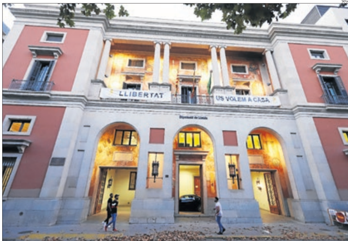
Eleccions directes i indirectes. El 28 de maig s'elegeix la composició dels ajuntaments, les EMD i el Conselh Generau d'Aran i, indirectament, la de la Diputació (a la imatge) i 13 consells, amb la Cerdanya.