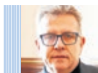
JOAN TALARN I GILABERT PRESIDENT DE LA DIPUTACIÓ DE LLEIDA I ALCALDE DE BELLVÍS

AQUESTA SETMANA hem celebrat el Primer Congrés Català de Repoblament, un esdeveniment de país en el qual conflueixen diferents línies de treball d'entitats, la Universitat i el món local. Aquest primer congrés vol ser l'inici que inspire noves polítiques en favor del món rural, aquest que ha estat més sacsejat en les darreres dècades per les desinversions dels governs que tenien la mirada més posada en les grans ciutats que en el país sencer.