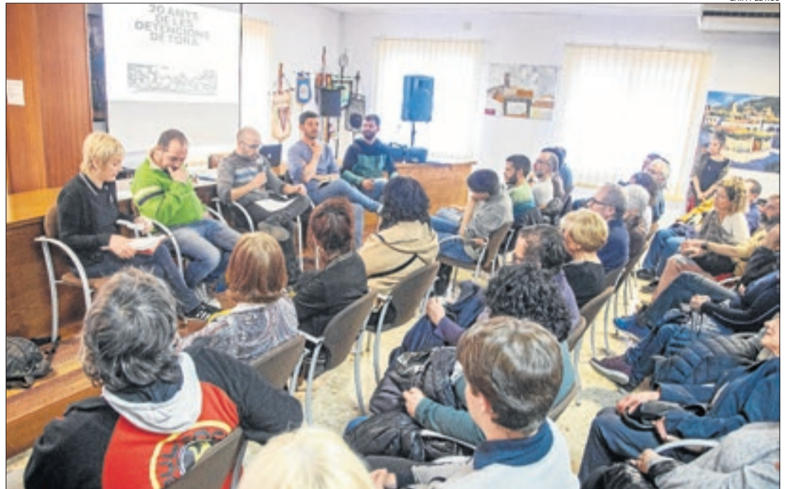
La sala de plens es va omplir ahir a vessar amb una taula redona.