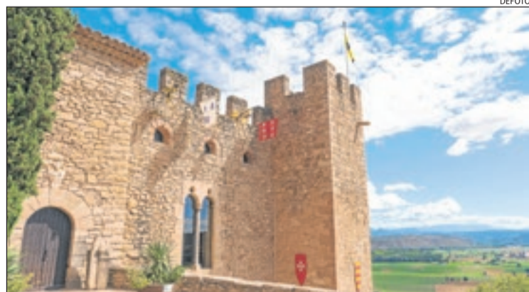
Castell de Montsonís.

sigui excepcional. Amb l'arribada del bon temps s'encavalquen el final de la temporada d'esquí, alpí i nòrdic, amb l'inici de la campanya d'esports d'aventura i turisme actiu. En ambdós casos, les comarques lleidatanes són re-