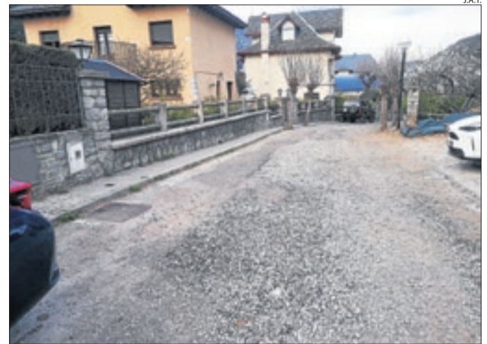
Un dels carrers del Pont on s'efectuaran millores.