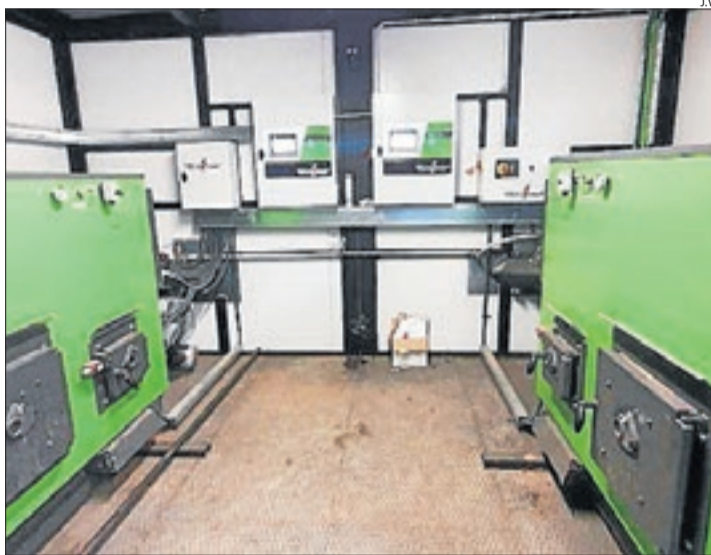
Les instal·lacions per dotar de calefacció edificis públics.

Els tècnics les van fer dijous passat i divendres es van posar en marxa les instal·lacions