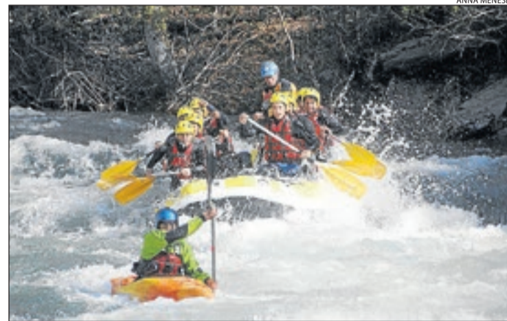
Llavorsí. Pallars Sobirà.

Quan la boira escampa és el moment de treure la pols a les motos i tornar a la carretera. Les comarques de Lleida tenen tot el que fa falta per aprofitar al màxim l'experiència sobre les dues rodes. Rutes precioses per convertir el trajecte en una experiència única, bons restaurants per fer parada i sobretot pobles amb un encant especial que fan que el viatge valgui la pena. Entre ells, per exemple, Durro (l'Alta Ribagorça), Arties, Garòs i Bagargue (la Val d'Aran), distingits entre els pobles més bonics d'Espanya. A més la demarcació disposa de 52 establiments d'allotjament i 44