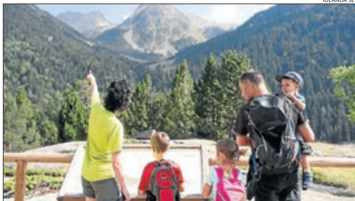
Turisme familiar. Parc Nacional d'Aigüestortes i Estany de Sant Maurici.

Al Pirineu hi trobem boscos i espais verds com el Parc Nacional d'Aigüestortes i Estany de Sant Maurici i els parcs naturals de l'Alt Pirineu i del Cadí-Moixeró, o la zona del Montsec i el congost de Mont-rebei , que esdevenen indrets excepcionals per a la pràctica del senderisme amb infinitat de rutes, des de les més