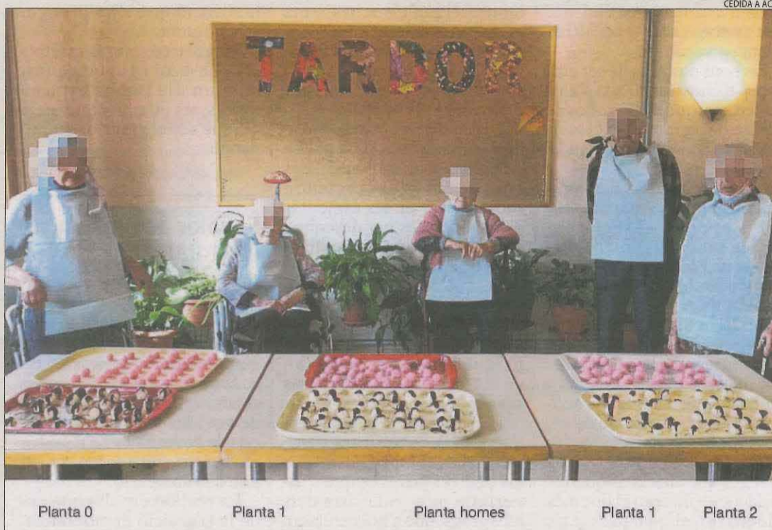
Usuaris de diferents plantes sense mascaretes a la festa de la castanyada a la residència el 2020.