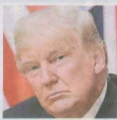
Expresident dels EUA

«El fiscal que m'acusa és un criminal. L'únic delictes que he comès és defensar el nostre país»