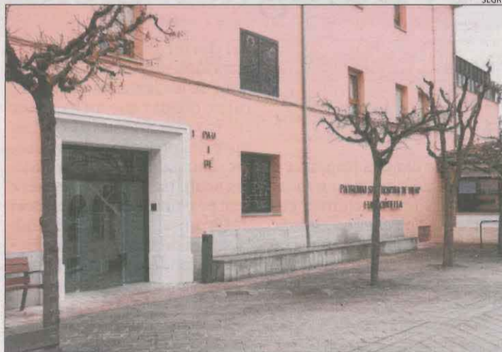
Imatge de la residència el desembre del 2020 després del brot.

havia al febrer va declarar la causa complexa i l'ha prorrogat sis mesos més, fins a principis d'agost. De fet, la causa s'ha demorat, entre al-