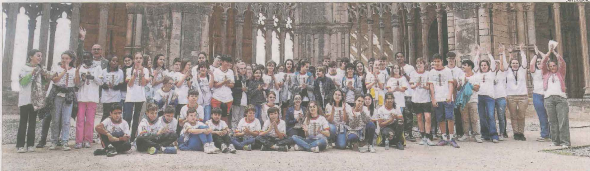
Un centenar de nens i adolescents de la ciutat es van citar a la Seu Vella per participar en diversos tallers i activitats.