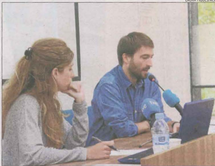
Presentació ahir de la memòria de Projecte Home Catalunya.

La cocaïna és la droga que més demandes de tractament provoca, amb el 46,9% dels casos, mentre que l'alcohol representa el 38,4%. En el cas dels homes, la cocaïna provoca un