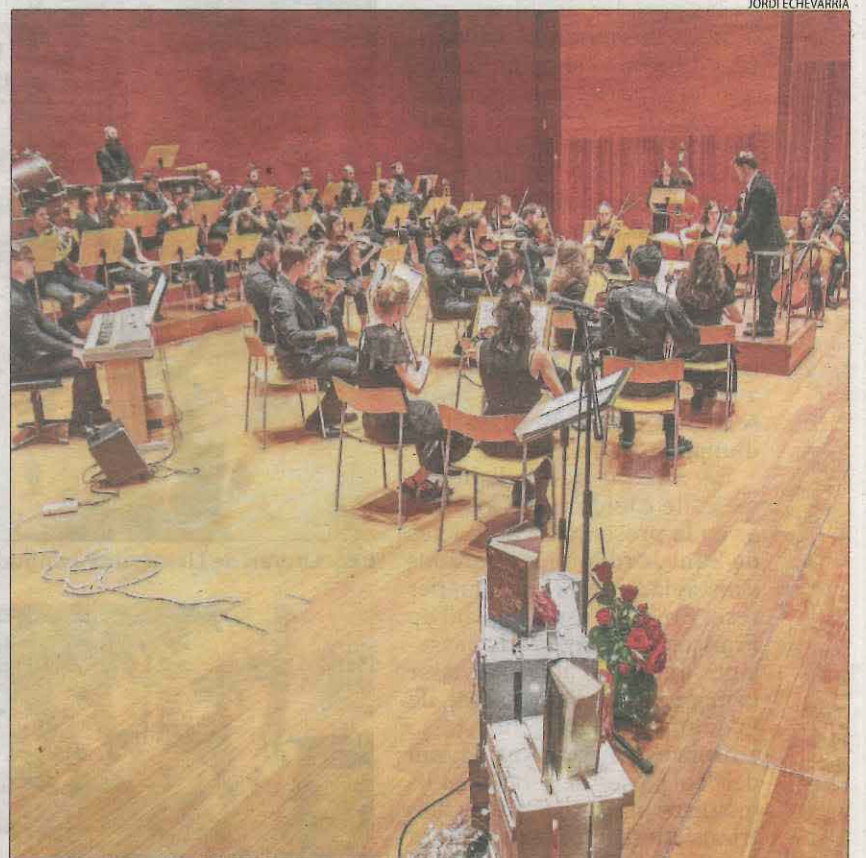
Concert de Sant Jordi a l'Auditori amb la Jove Orquestra de Ponent.

a Tàrraga, que al final va allargar Sant Jordi tota la jornada, davant de la previsió inicial de tancar al migdia, informa Laia Pedrós. A Cervera, una diada també amb èxit de públic va culminar amb la representació de la llegenda de Sant Jordi al carrer Guinedilla i els patis de la Universitat, a càrrec de l'Escola de Teatre la Caserna, informa X. Santesmasses. Sant Jordi també es va saldar amb gran èxit de participació a la resta de capitals i altres localitats, des de Balaguer i Mollerussa a Vielha, la Seu d'Urgell, Solsona, Tremp, Sort, les Borges i el Pont de Suert.