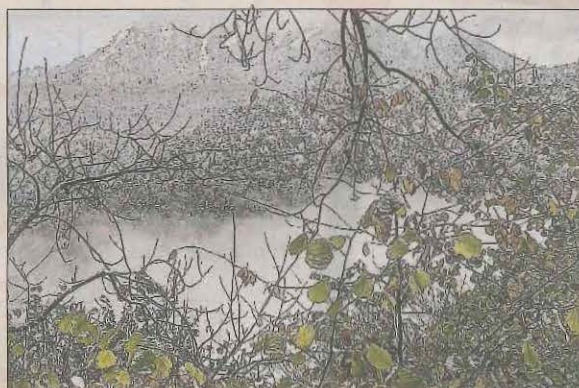
Una de les imatges que il·lustren el programa.

Des d'avui i fins al 2 de maig se celebra el Black Mountain Bossòst, el festival de novel·la negra i senderisme que en aquesta edició s'amplia amb novel·la històrica, recitals, cine, jazz, òpera, conferències, gastronomia, teatre i altres activitats. Comença amb la projecció de la pel·lícula Seven . Al migdia, la conferència Asesinar nunca pasa de moda . A la tarda es presenten tres llibres, s'obre un debat literari i s'entrega el premi Fernando Marías.