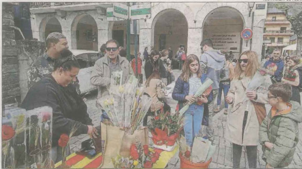
Vielha. Desenes de veïns de la capital aranesa van sortir ahir al carrer per celebrar Sant Jordi i el col·lectiu Lengua Viua va dur a terme una lectura pública de diferents autors.