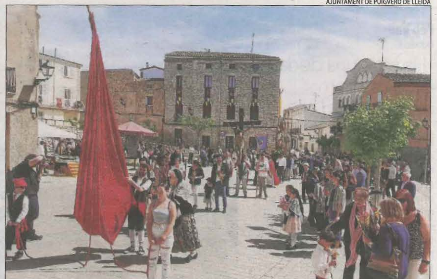
Puigverd de Lleida. Va celebrar la festa major de Sant Jordi amb actes com la processó i la benedicció del terme, durant la qual es va demanar que ploqui.