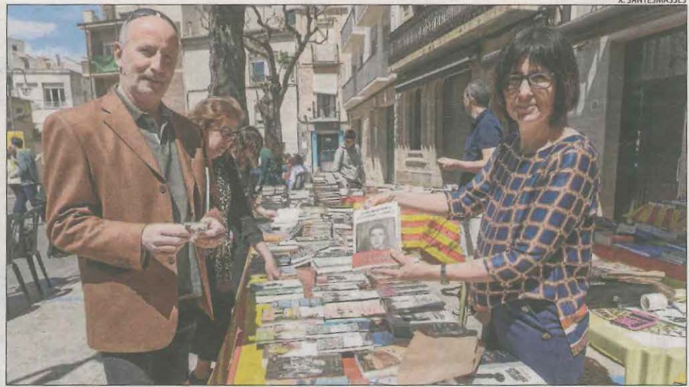
Guissona. Les parades de llibres i roses van omplir de públic el centre històric d'aquest municipi de la Segarra i la colla castellera Els Margeners van celebrar els seus 16 anys a la plaça Major.