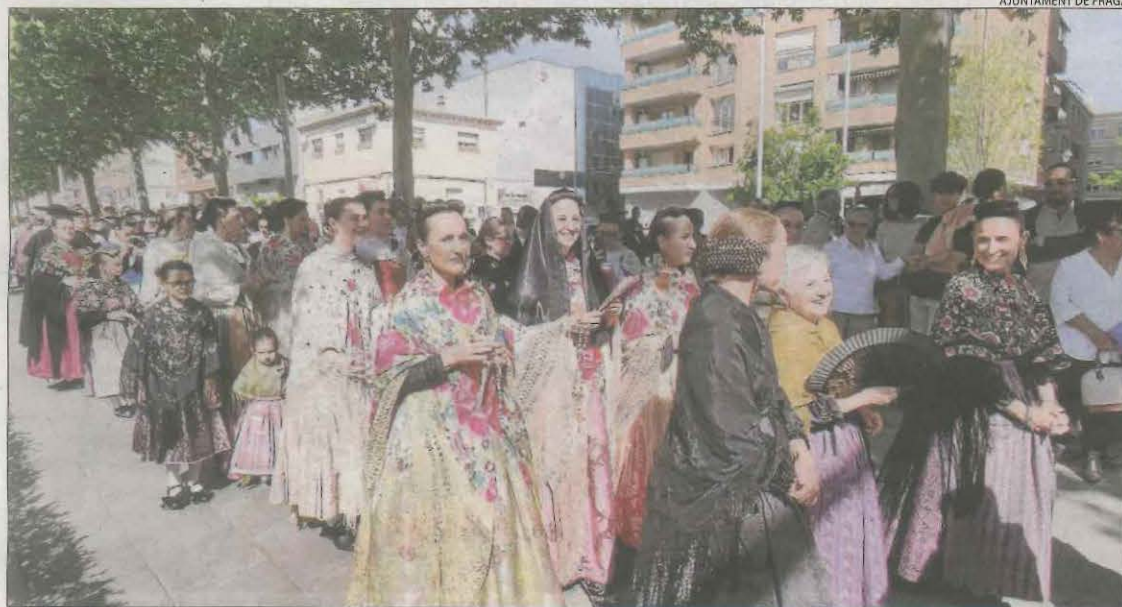
Un moment de la celebració ahir del Dia de la Faldeta a Fraga.