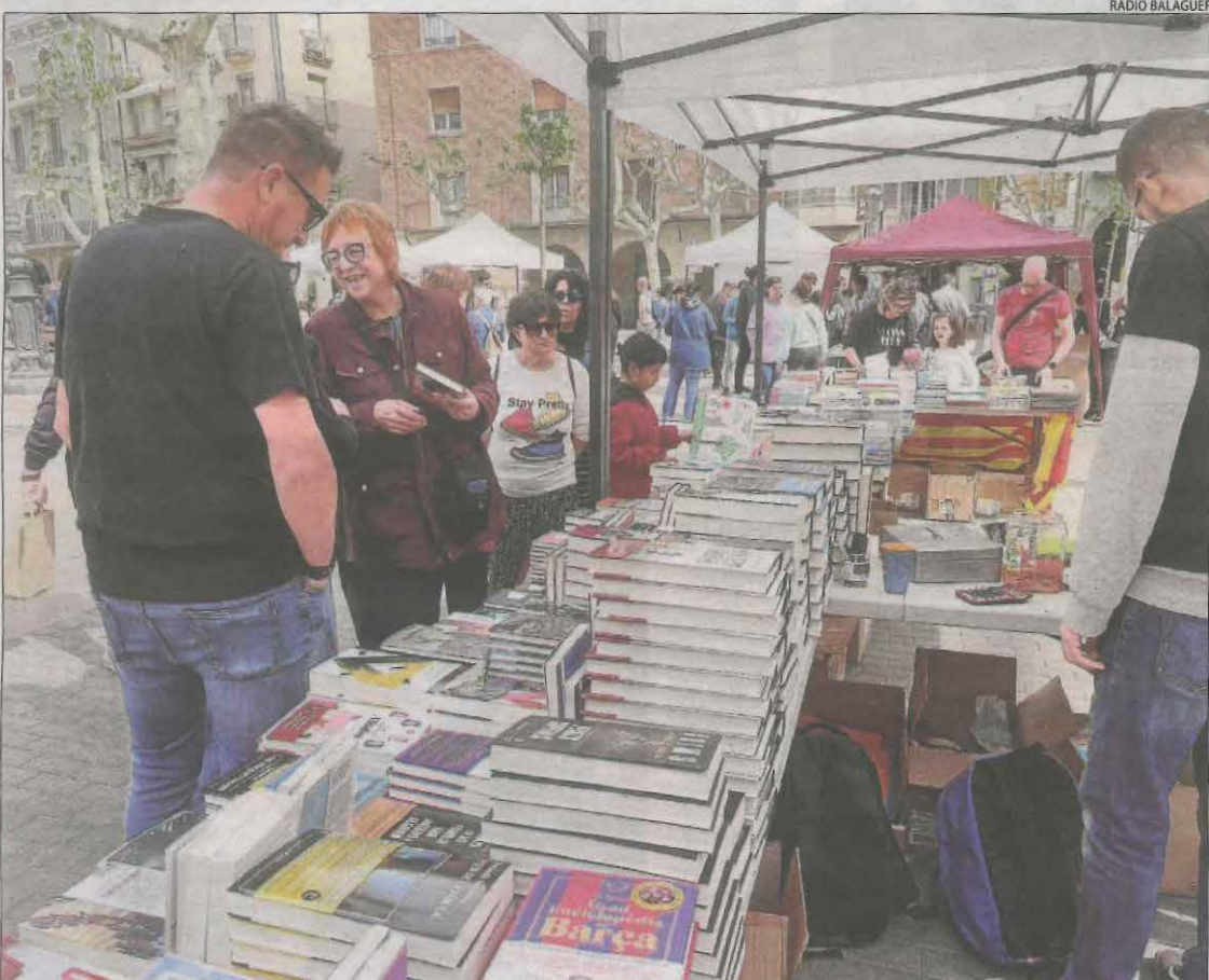
Balaguer. La capital de la Noguera va celebrar dissabte la segona edició de la Nit de la Cultura, mentre que la plaça Mercadal es va omplir diumenge de parades de llibres i roses durant la diada.