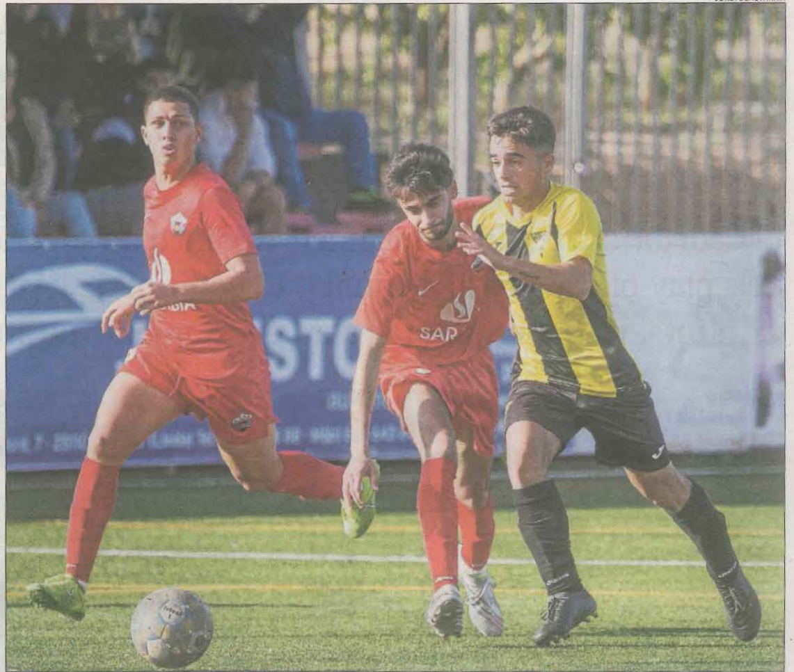
Un jugador del Pardinyes B condueix l'esfèric davant la pressió d'un jugador local.