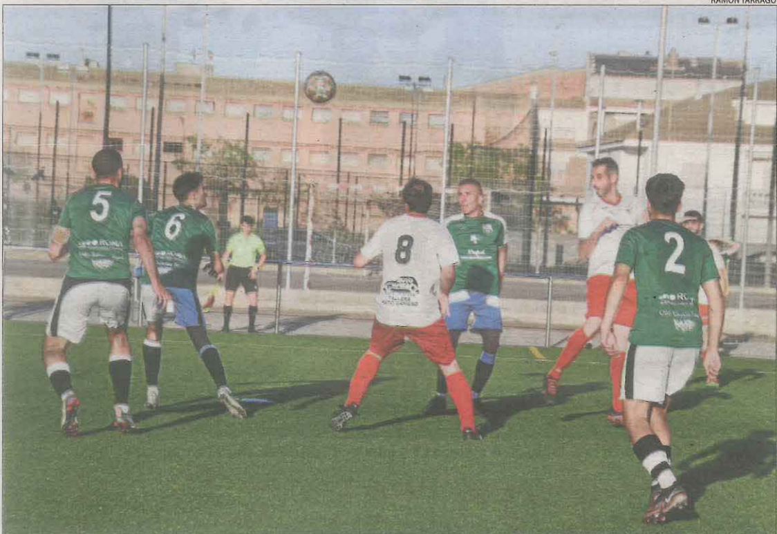
Els jugadors del Borges intenten controlar una pilota aèria pentinada per un del Linyola.

Després del gol, el Borges, que jugava amb un més, va continuar dominant i no va deixar al Linyola crear perill a la seua porteria, mantenint el 2-1 que els donava els tres punts.