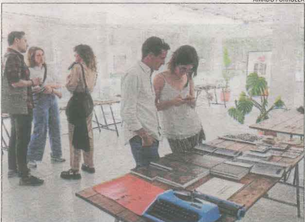
Diada alternativa en el BangBang del carrer Pallars.