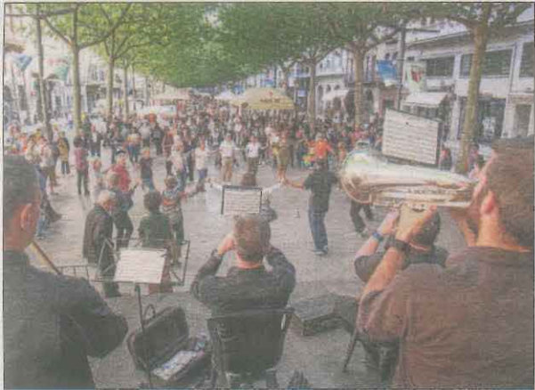
Sardanes a la tarda a Ferran amb la Bellpuig Cobla.