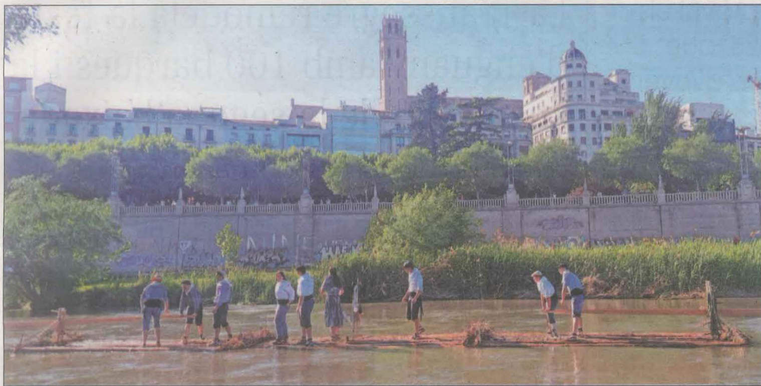
Els raiers de la Pobla de Segur ahir a la tarda als peus de la Seu Vella de Lleida