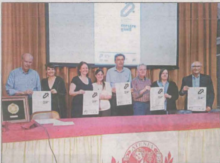
El local social de l'Ateneu va acollir la presentació

Pel que fa als premis del jurat de la fira, d'entre tots els que es van entregar, cal destacar el Drac d'Or Julieta Agustí al Millor espectacle de la Fira, que va ser per a Loco , de la companyia Belova-Iacobelli. Des de l'organització de la Fira de Titelles van fer una valoració "molt positiva" i van destacar que durant tots els dies, les places, carrers i sales on es van dur a terme els diferents espectacles es van omplir de famílies. En paral·lel, l'organització també va aprofitar per anunciar les dates de la 35a Fira de Titelles, que tindrà lloc els dies 3, 4 i 5 de maig de 2024.