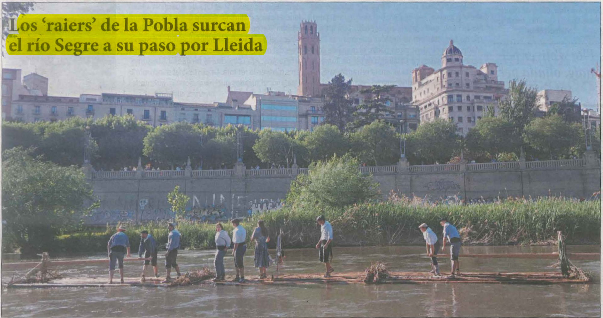
Nueve jóvenes revivieron ayer por la tarde en la capital del Segrià el tradicional oficio del transporte de madera por el río desde el Pirineu COMARQUES | PÁG. 17