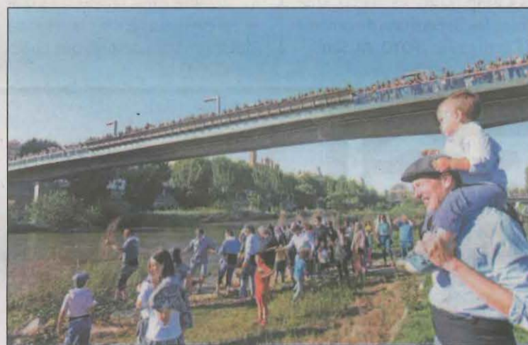
El descens va atraure a molts curiosos a la capital del Segrià

de l'Associació Cultural dels Raiers de la Noguera Pallaresa, enguany s'ha programat un festival adreçat principalment a famílies amb nens petits, "combinant així