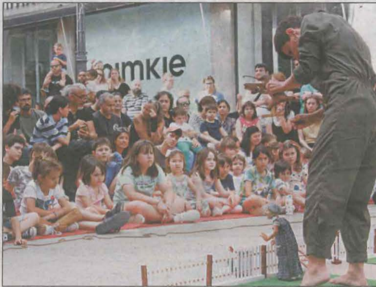
Un dels espectacles de la Fira de Titelles

Diuenge es van entregar els Premis Drac d'Or, que van guardonar l'espectacle Suspended Animation de la companyia Huber Marionettes amb el Premi del Jurat Infantil; Manual de