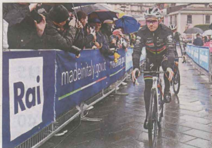
Un perro provocó una fuerte caída de Remco Evenepoel