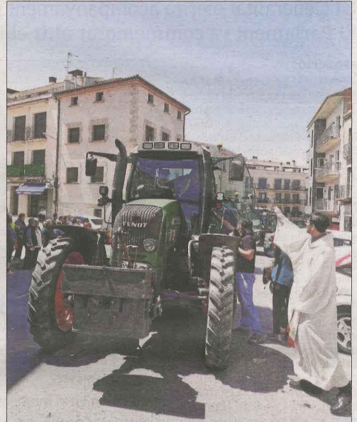
AJUNTAMENT DE BELLPUIG