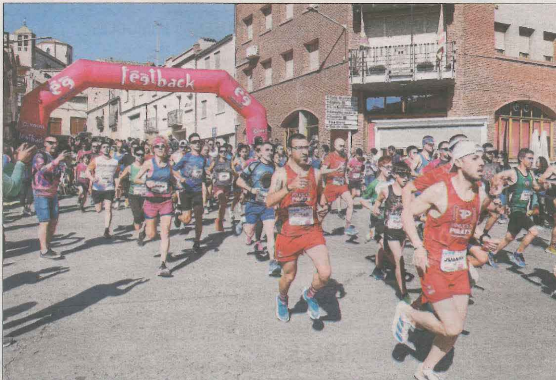
Imatge de la sortida de la competició, a la plaça Sant Jaume de Miralcamp.

tercer, i amb un punt de marge sobre CET 10 i Vilassar. D'altra banda, el Linyola va guanyar el Gràcia (7-5) i manté opcions de permanència i l'Alcoletge va empatar 3-3 contra el Bosco.