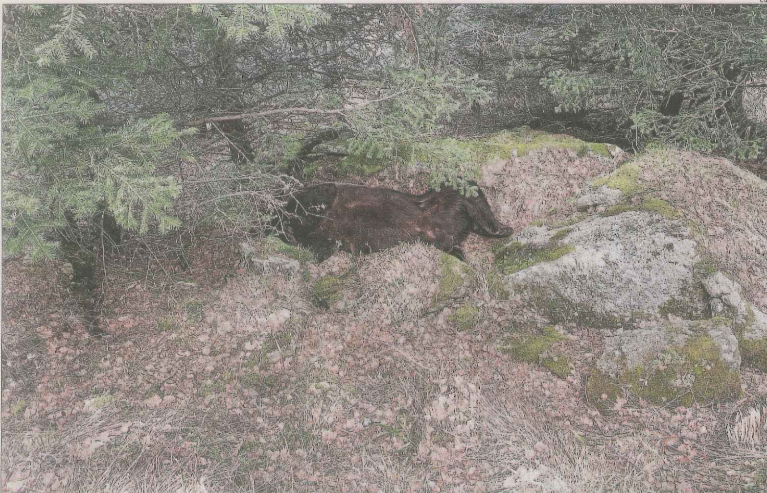
El cadàver de l'os Cachou va ser trobat al municipi de Les l'abril del 2020.

La mort de Cachou a Les va evidenciar tensions pel creixement d'aquestes espècies al Pirineu