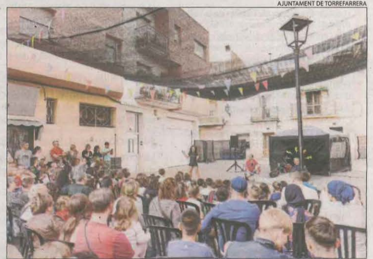
Moment d'un dels espectacles que s'hi van representar.