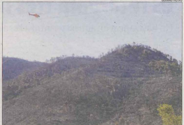
Un foc va calcinar a l'abril 400 hectàrees a la Franja i el Baix Segre.

Per exemple, el Pla Alfa, el mapa que marca el risc d'incendi forestal amb els diferents nivells de perill i les actuacions a seguir, ha canviat per com-