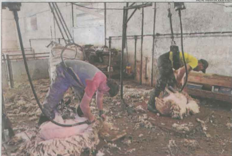
Esquiladors en una explotació del Sobirà.