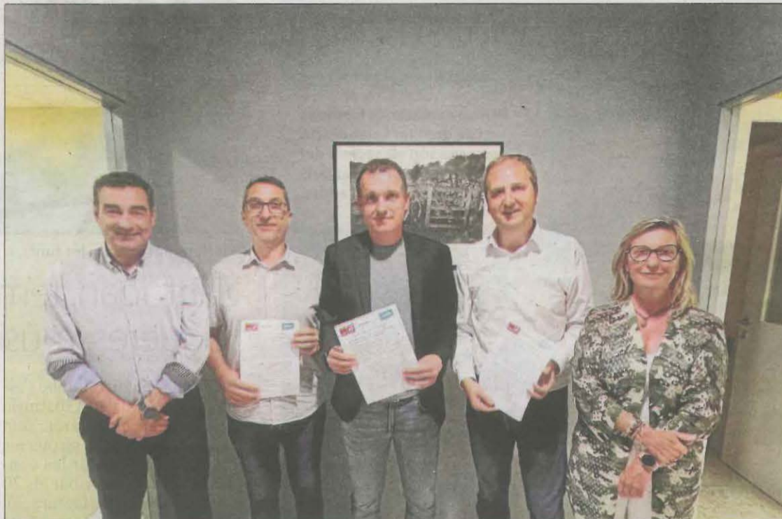
Presentació de l'acord del consell del Segrià entre Junts-Impulsem i PSC.

Al Jussà, els vuit consellers d'ERC i els cinc de Candidatura de Progrés (PSC) van arribar a un preacord per formar