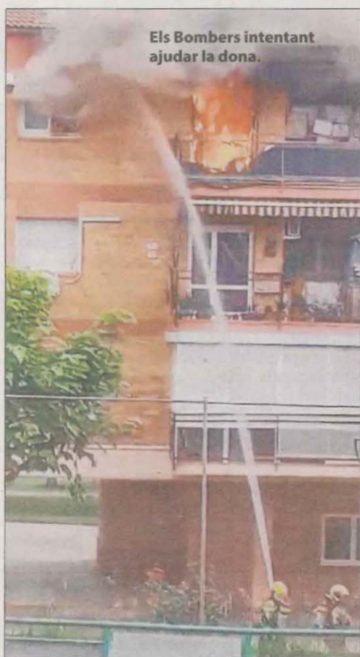
Els Bombers intentant ajudar la dona.

Una dona de 49 anys va morir ahir a primera hora del matí a Balaguer quan es va llançar al buit des d'una finestra per mirar de fugir d'un incendi al seu habitatge, en el qual hi havia un home, que va resultar ferit de caràcter greu. L'accessibilitat al bloc va complicar els treballs d'Emergències.