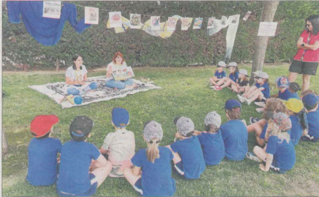
La campanya 'Al Segrià, piscines cívi-ques' va arrancar ahir als Alamús amb tallers per a escolars.

Bosch va apuntar, en aquest sentit, que "les piscines són un espai d'esbarjo on més poden