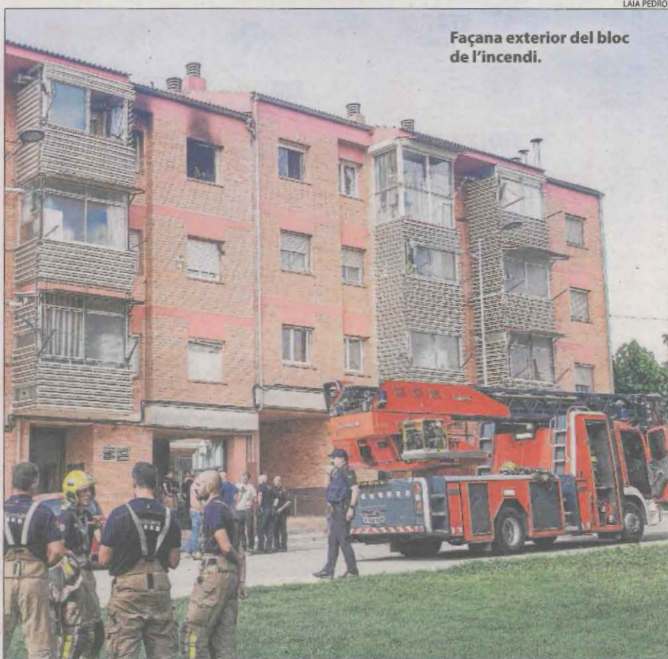
Façana exterior del bloc de l'incendi.