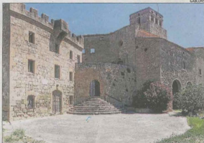
Imatge d'arxiu del castell de Ribelles.