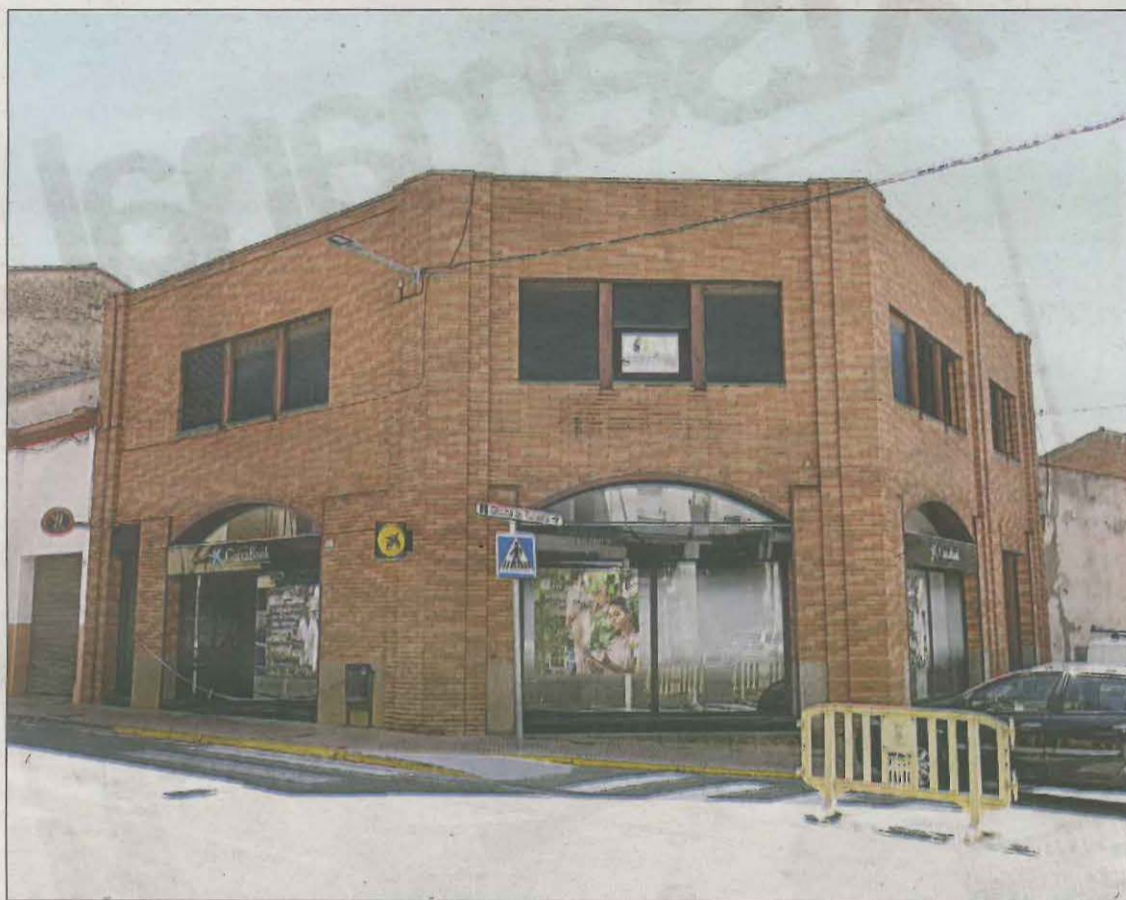
Imatge de la sucursal bancària que ahir va patir l'atracament, situada a l'Avinguda Alt Urgell

Pel que fa als fets, durant la matinada les dues persones van entrar a l'edifici on es troba la sucursal per una porta que hi ha en un lateral de l'edifici després de forçar el pany. Un cop a l'interior, van fer un forat a la paret i van poder accedir a una de les sales de l'oficina. Allà es van esperar fins que cap a les 8.00 hores van arribar dos treballadors i van desconnectar l'alarma de la sucursal i la de la caixa forta. En aquell moment, els lladres van sortir, els van increpar, els van lligar i després van fugir a peu amb una suma de diners que no va transcendir. Finalment, els treballadors es van poder deslligar i van avisar els Mossos d'Esquadra.