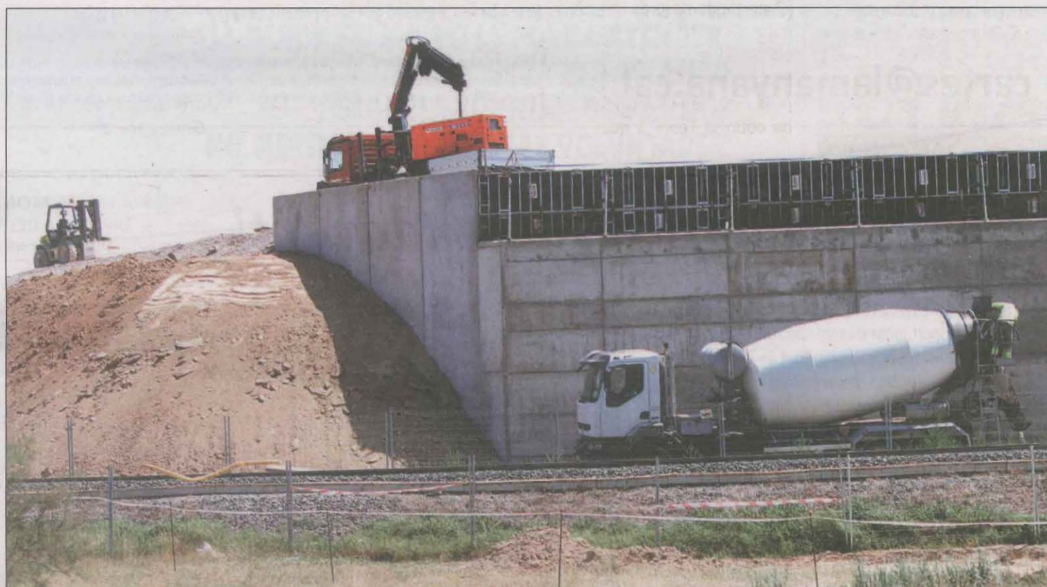
Els operaris estan fent tasques de terraplenat i pròximament es col·locaran les bigues i s'executarà la llosa

També a la línia Lleida - La Pobla, Ferrocarrils està avançant en la supressió del pas a nivell 16 a Vallfogona de Balaguer, fruit d'un conveni amb l'ajuntament. Actualment, s'ha iniciat el procés d'expropiació, un cop la Direcció General d'Infraestructures de Mobilitat ha fet l'aprovació tècnica del projecte executiu. El projecte preveu substituir el pas a nivell, que a hores d'ara serveix al "Camí de la Coma", per un d'ele-