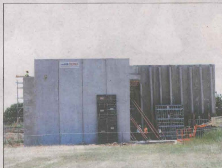
Feines per construir l'estructura del pont