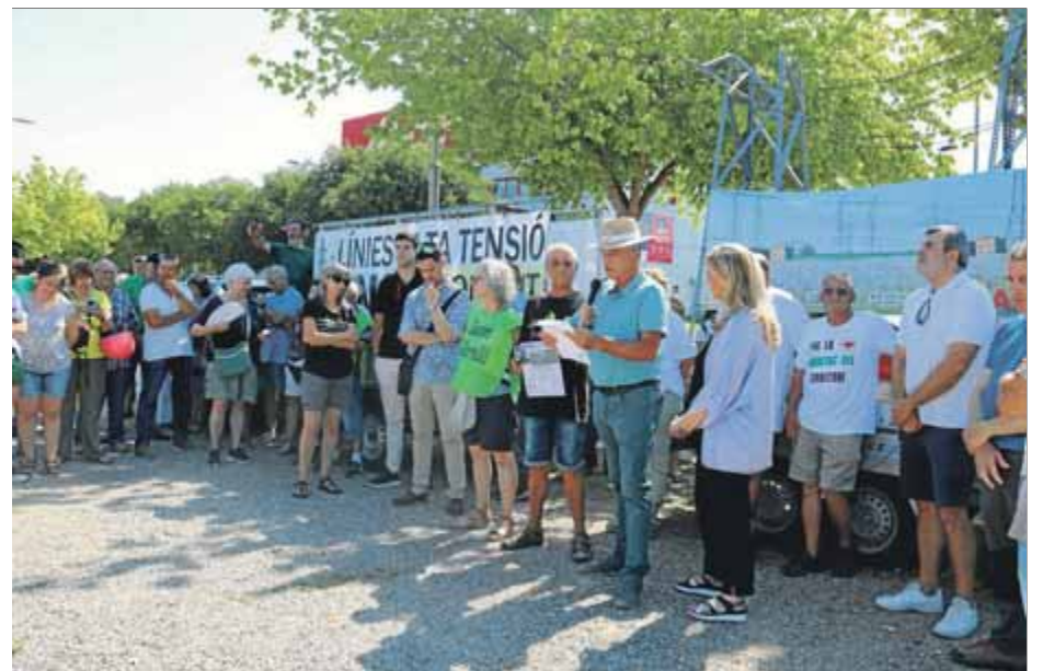
■ Dos moments de les protestes d'ahir a Tarragona (a dalt) i a Lleida

dues de les línies d'alta tensió. Així, proposen que es prioritzi la implantació dels parcs de renovables en espais degradats com ara abocadors o pedreres abandonades, i s'aprofitin superfícies urbanes o ja alterades per l'home com teulades, pàrquings, vies de comunicació, hivernacles o polígons industrials.