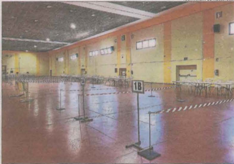
Una dona votant ahir a la tarda en una oficina de Correus de Lleida i, a la dreta, preparatius al pavelló de Mollerussa.