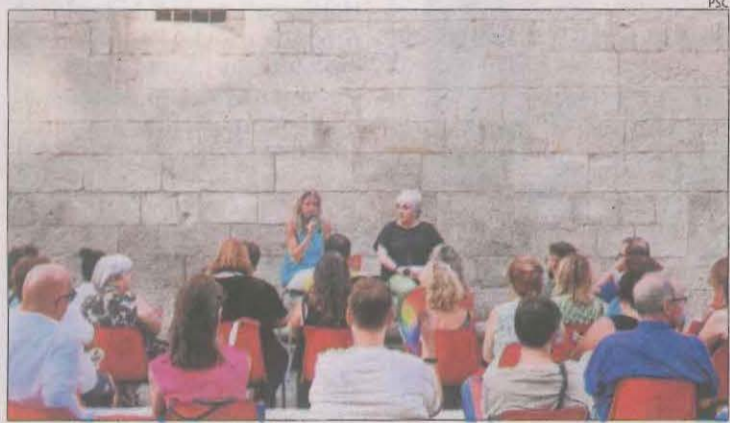
Imatge de l'acte 'En els drets de les dones, ni un pas enrere'.