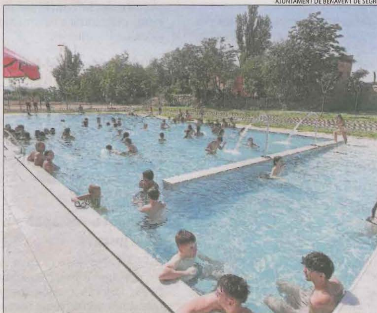
Alguns dels veïns que van estrenar ahir les piscines de Benavent.

obrir ahir a les 11.00 hores i l'accés va ser gratuït durant tota la jornada. A més, gràcies a un conveni entre els ajuntaments de Benavent i de la Portella, els usuaris podran compartir piscines, de manera que totes les persones que siguin titulars d'un abonament per a una de les dos piscines podrà accedir a qualsevol. El projecte ha costat 750.000 euros i ha comptat amb una ajuda del Puosc de 170.000 euros.