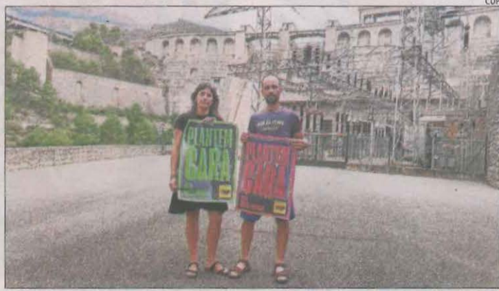
Sauquillo i Quingles, ahir davant la presa del pantà d'Oliana.