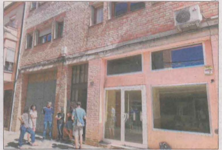
Els promotors, al bloc de pisos que es rehabilitarà.