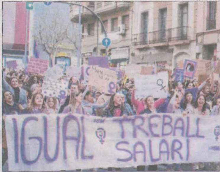
Manifestació de Marea Lila el mes de març passat.

Una altra de les conclusions a les quals han arribat les investigadores és que l'auge de l'activisme i dels referents feministes dels últims anys ha influït sobre les dones entrevistades. La seua narrativa audiovisual mostra com ha crescut la seua consciència crítica quant a la