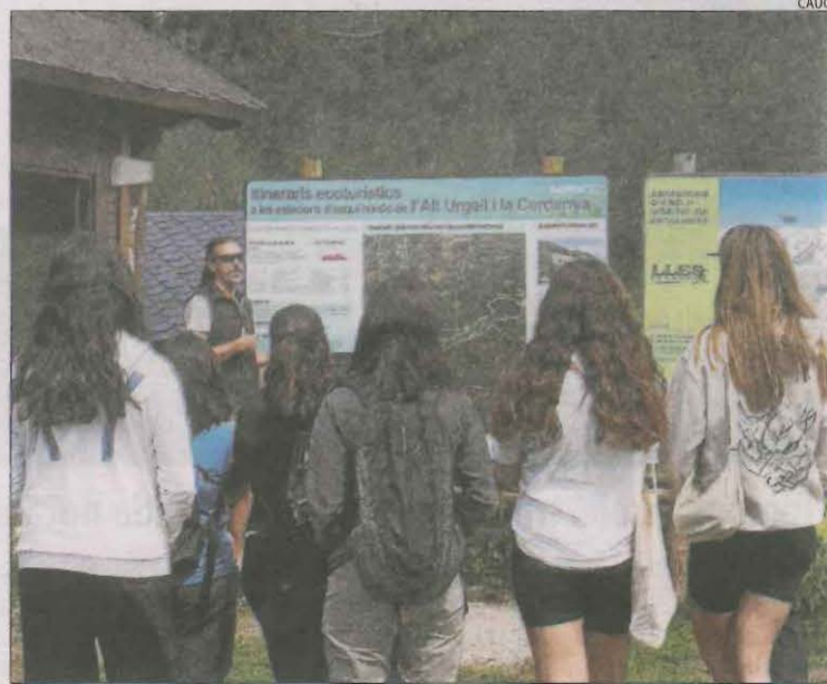
La presentació dels senyals de les rutes turístiques.