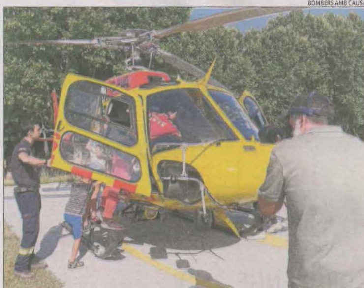
La sessió fotogràfica de dilluns al parc de Bombers de Tremp.

Els efectius del cos els van explicar com apaguen els incendis des de l'aire, la importància d'anar ben lligat amb l'arnès i de portar el casc a l'hora de fer tirolina i els diferents tipus de líquid que utilitzen per sufocar focs.