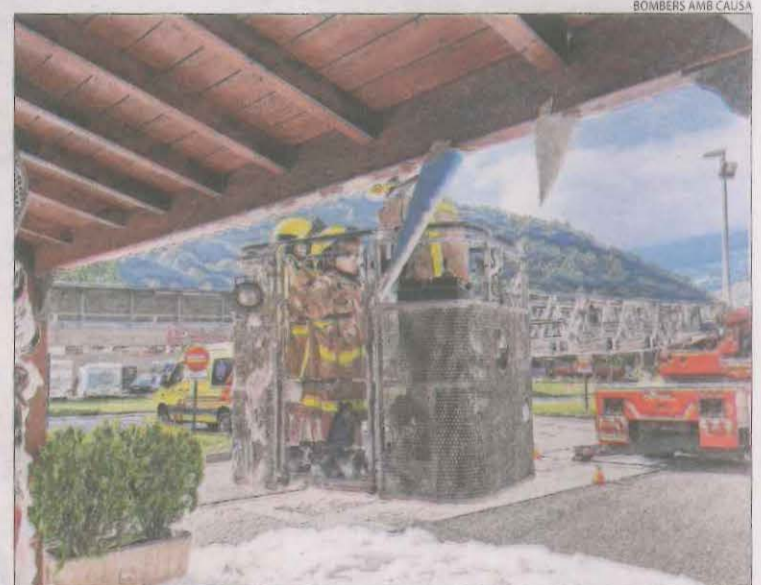
Gael i Ilán van protagonitzar la sessió del calendari a Vielha.

re les estalactites del parc amb el camió escala. Com a resultat, les imatges van plasmar la complicitat dels nens amb el cos de Bombers d'una forma divertida. Així mateix, la petita Aran, de 13 anys i atesa a l'Hospital Sant Joan de Déu de Barcelona, va protagonitzar les fotografies al costat dels bombers de la Seu