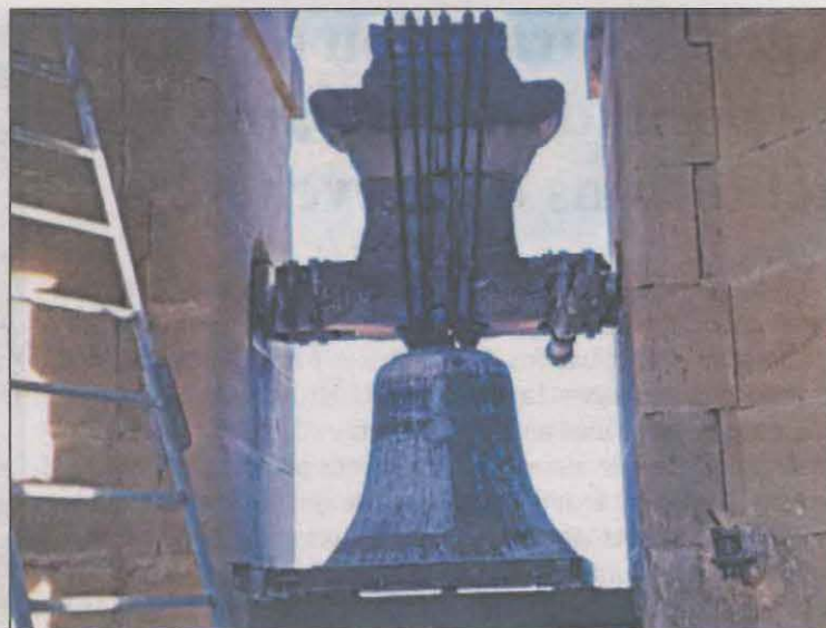
La campana és de bronze i pesa 500 quilos

Els impulsors expliquen que el desig dels veïns és "recuperar una campana del segle XVIII tant pel seu valor històric i artístic com sentimental" i fan una crida a col·laborar. En el marc de la campanya, es va organitzar una jornada de portes obertes per explicar la història de la campana i la informació aconseguida i durant aquest any es venen samarretes i es faran caminades, tastos de vins i vistes de les postes de sol des del campanar per recaptar diners.