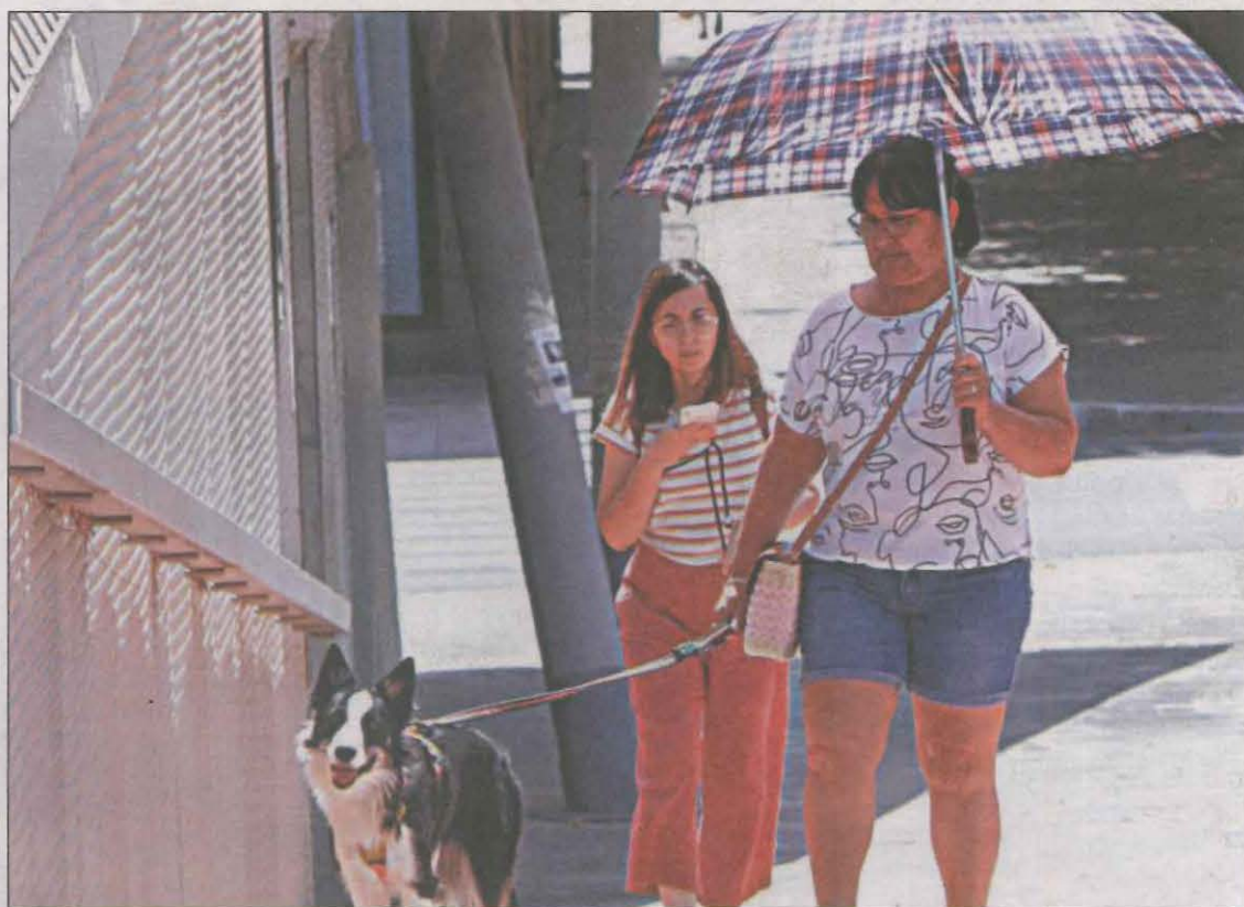
Una dona es protegeix de la calor amb el paraigua a la ciutat de Lleida

Segons l'alerta del Servei Meteorològic de Catalunya, Lleida s'encamina cap a una nova onada de calor marcada per les altes temperatures després d'uns últims dies en els quals els termòmetres van registrar uns nivells baixos per al que és habitual en aquesta època de l'any. Avui, s'esperen entre 37 i 38 graus, tot i que serà demà el dia de més calor, ja que es preveuen 40 graus a la capital del Segrià. Divendres tot apunta que la temperatura es moderarà, però poc, ja que els termòmetres poden assolir els 38 graus. Cal recordar que el passat