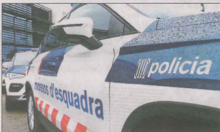
El detingut va declarar ahir al matí al jutjat de Tremp

mesura es va prendre d'acord amb les peticions de Fiscalia i la representació de la víctima com a acusació particular. Els fets es remunten a la matinada de divendres, quan l'home va ser detingut com a suposat autor d'una agressió sexual. Segons ha pogut saber aquest diari està vinculat familiarment a Esterri tot i que no hi viu habitualment (sí que residiria en un poble de la comarca). Els fets van coincidir amb la Festa Major però es desconeix si s'haurien produït en aquest entorn.