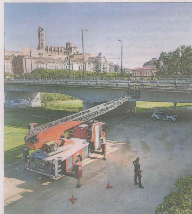
Bombers i Urbana van 'blindar' el viaducte

Un foc al quadre de llums d'un edifici del Passatge Cádiz de la Mariola va obligar ahir a desallotjar i confinar els veïns que hi vivien, segons va explicar la Guàrdia Urbana. El foc va provocar molt fum i per això es va haver de dictaminar aquesta mesura. A l'hora de tancar aquesta edició, els veïns ja havien pogut tornar a l'immoble. D'altra banda, els Bombers també van apagar un foc de matolls al matí a l'entorn dels Blocs Joan Carles.