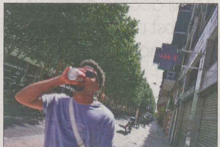
Un jove pren un refresc a Doctora Castells

Per la seva banda, des de Bombers i coincidint amb el Dia Mundial de la Prevenció d'Incendis Forestals, recorden la importància de cuidar els boscos i extremar precaucions per evitar possibles focs. Ahir ja es van marcar pics de calor a municipis com Castellnou de Seana amb 38,7°C, Tremp amb 38,3°C, la ciutat de Lleida amb 38,2°C o Gimènells amb 38,1°C. Però sembla que a partir d'avui encara poden pujar més el termòmetre amb alguns registres que es poden enfilar fins als 40°C en diferents punts del Pla de Lleida.