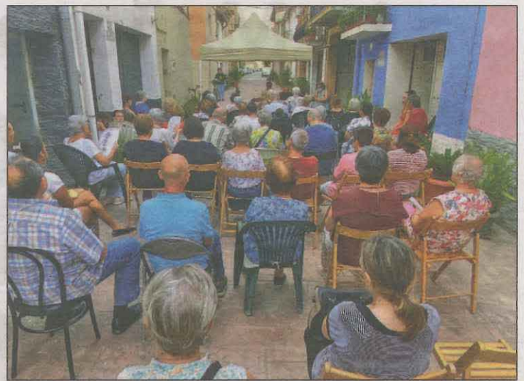
Un dels actes que va tenir lloc