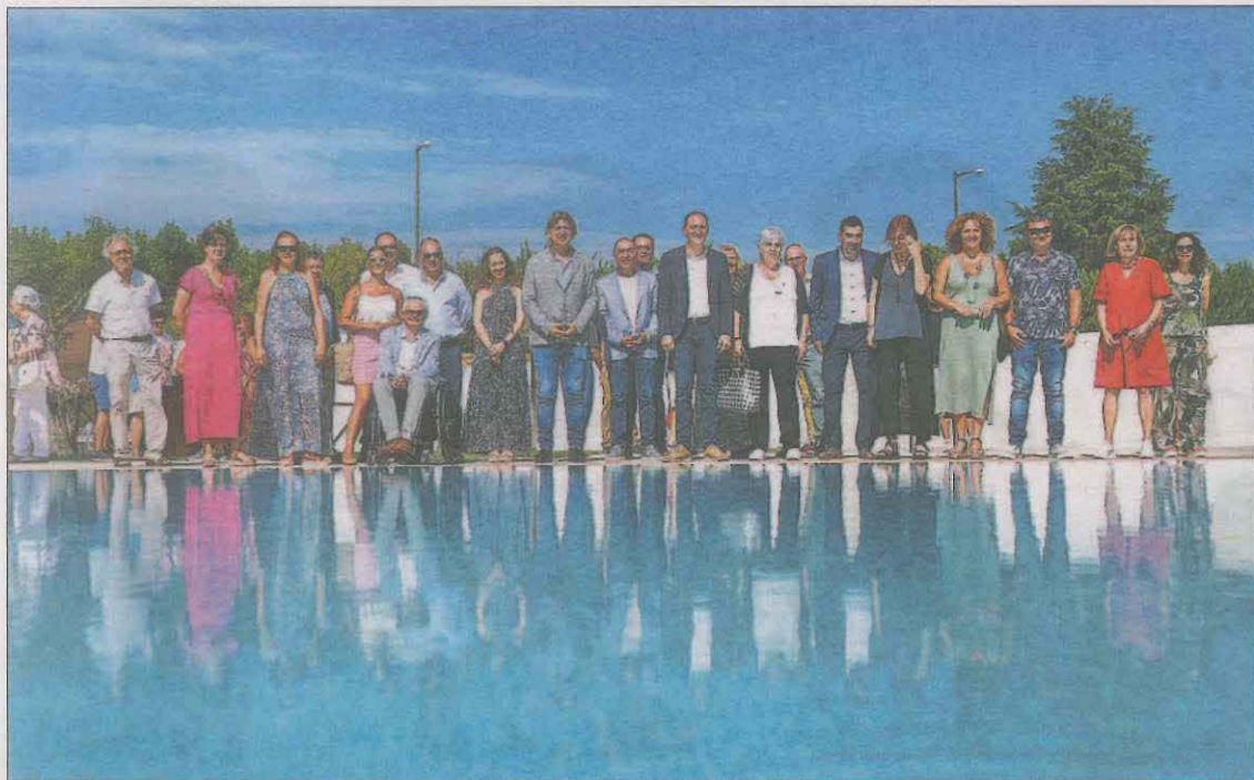
Les noves piscines municipals de Torre-serona van ser inaugurades ahir