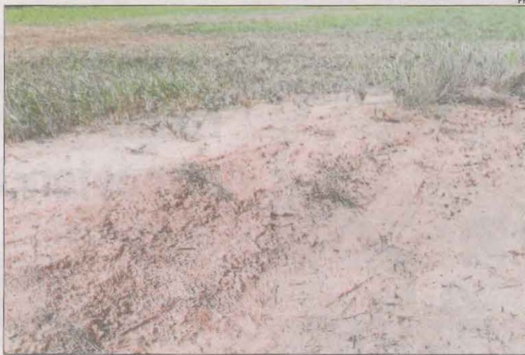
Marques de rodes en un bancal de la partida de Marimunt.

Per la seua part, un integrant de la junta de l'associació de veïns de la partida de Marimunt va detallar que divendres a la nit es va registrar un robatori en una torre i almenys un intent en una altra. Va explicar que havien detectat cotxes de persones que semblaven vigilar la zona. "Estem preocupats i no sabem què fer. No estem tran-