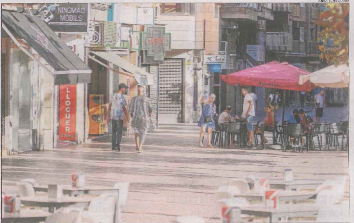
Un termòmetre ubicat al sol al carrer Pi i Margall va arribar a marcar ahir al migdia 49 graus.