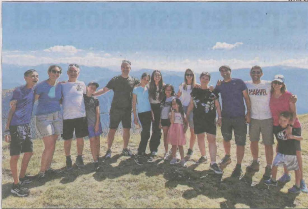
La família de turistes israelians, en la visita a Aigüestortes durant el dia d'ahir.

Pel que fa al turisme rural, fins a final d'agost l'ocupació mitjana és d'un 70%, mentre que per al pont de l'Onze de Setembre s'estima que serà d'entre un 30 o 40% a l'espera de les reserves d'última hora, segons va indicar la presidenta, Núria Ferrando. L'inici del curs escolar és la causa principal d'aquest descens, va indicar.