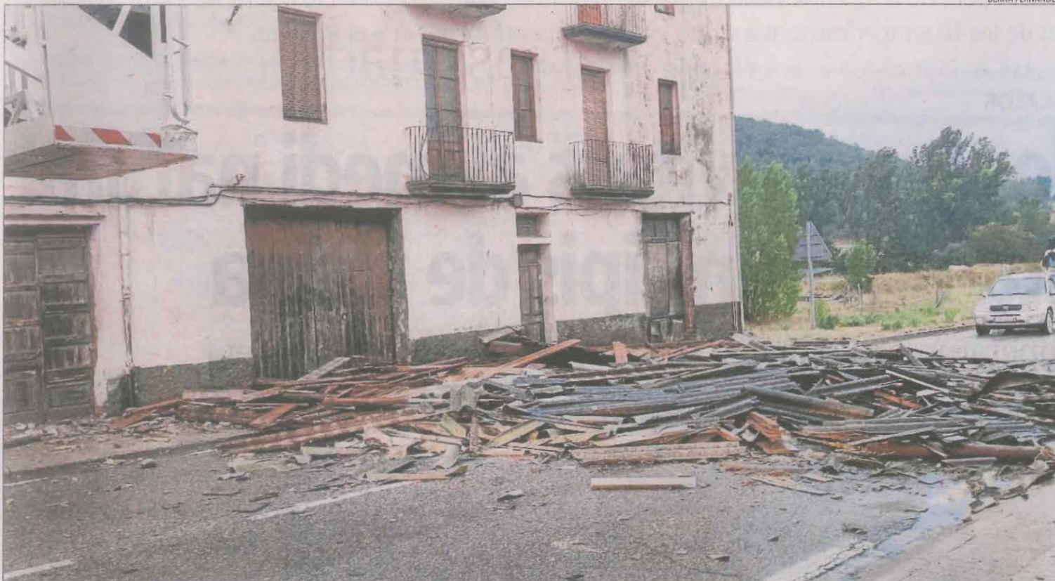
Vista de la teulada d'una casa que va caure ahir a la carretera N-260 a causa del temporal de vent a Adrall.