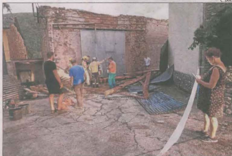
La coberta d'un edifici, a terra ahir a l'interior d'Adrall.

Al mateix terme municipal va volar la teulada de dos cases, també sense risc estructural per als edificis. En canvi, sí que hi va haver afectació en l'estructura d'un magatzem al carrer Portal, en què el vent va aixecar la coberta. Els tècnics van detectar que un pilar no era estable i els Bombers van assegurar la zona. També va caure un tros de teulada en un aparcament. La caiguda de teulades va tallar les carreteres C-14 i N-260 i va provocar retencions. Veïns van ajudar en les tasques de retirar els fragments caiguts a la via pública i no es van haver de lamentar danys personals. El temporal va provocar, així mateix, la caiguda d'arbres a la Seu d'Urgell, Peramola i Oliana. En aquest últim municipi, Bombers, edils i veïns van treballar per retirar l'aigua després d'una inundació al poliesportiu. L'edifici ja havia patit danys a l'últim temporal,