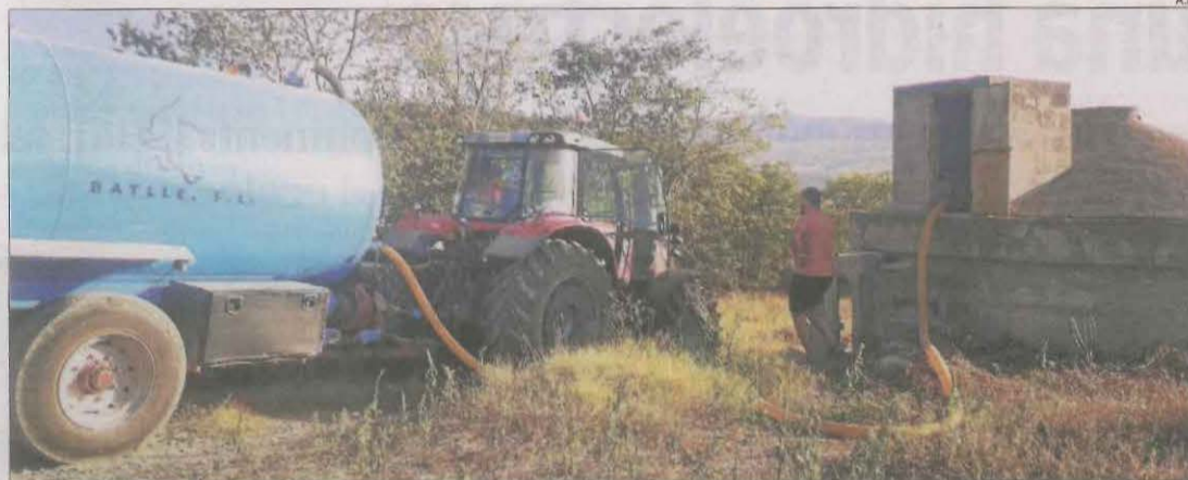
Cisterna per proveir la població de Figuerola d'Orcau.

Amb fins a 3.000 €, i se sumen a les Borges Blanques i Bellpuig Isona també porta cisternes a Biscarri i a l'assecar-se la font