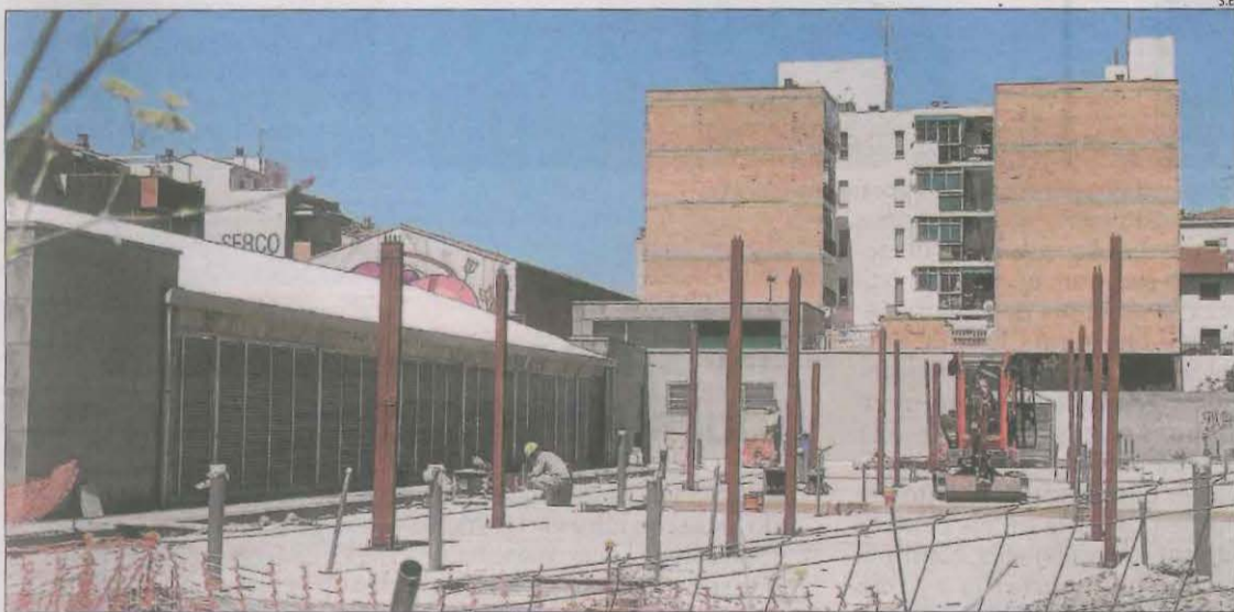
Les obres d'ampliació del CAP Bordeta-Magraners.

LLEIDA | El departament de Territori va publicar ahir al Diari Oficial de la Generalitat de Catalunya la declaració de 140 municipis catalans, 10 a Lleida, com a zones de mercat tensionat per poder limitar el preu del lloguer. Ha enviat la llista al ministeri d'Agenda Urbana perquè la validi i poder aplicar la limitació "com més aviat millor". Els municipis lleidatans són Lleida, Balaguer, Cervera, Guissona, Mollerussa, la Seu, Solsona, Sort, Tàrrrega i Tremp. La llei d'Habitatge preveu que el ministeri ha d'aprovar una resolució que reculli la relació de les zones tensionades declarades pel Govern, que tenen una vigència de tres anys. En aquestes àrees, el lloguer dels nous contractes no podrà superar el preu de l'últim vigent en els últims cinc anys, una vegada aplicada la clàusula d'actualització anual.