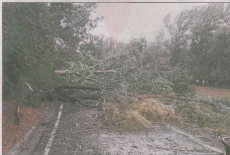
Arbres caiguts al camí d'Arfa de la Seu d'Urgell.

de manera que hi havia una part de la teulada al descobert i el consistori va aixecar una espècie de barricada per evitar que l'aigua fes més destrosses. D'altra banda, al camí d'Arfa de la Seu, diversos arbres van tallar