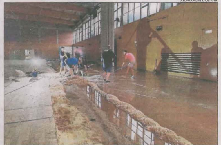
Veïns i edils traient aigua del poliesportiu d'Oliana.

la circulació. També van caure arbres a la C-26 a Bassella. A Ponts, un arbre va caure sobre una línia de mitjana tensió i sobre un vehicle. Van arribar a més de 20 litres al Pallars i en el Solsonès. Hi va haver avi-