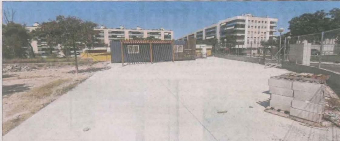
El nou local social de Gardeny, envoltat per una tanca que tanca el seu perímetre.

Els veïns tenen les claus del seu local des de principis de juny, malgrat que ja portava mig any instal·lat. Expliquen que l'anterior govern d'ERC i Junts els les va entregar el divendres 26 de maig, dos dies abans de les eleccions municipals, però encara "no està habilitat, només tenim aigua corrent des de fa un