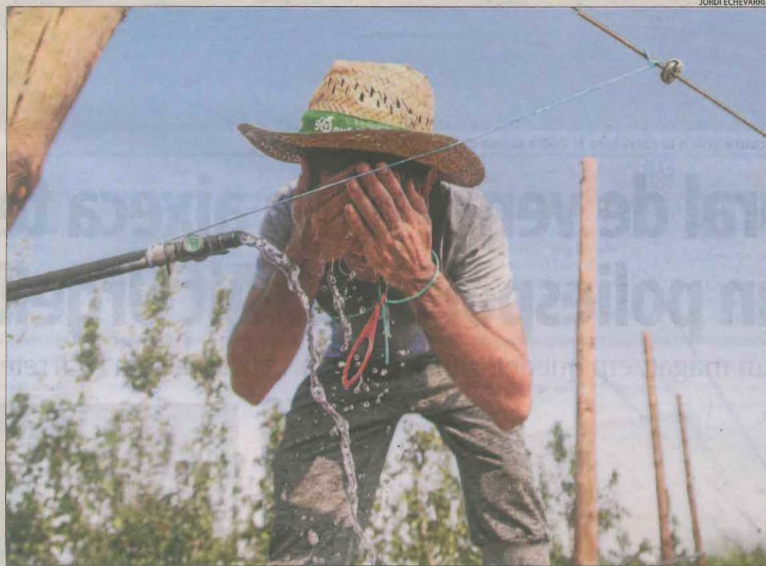
Un agricultor de Mollerussa es refresca durant una sufocant jornada de recollida de pera.

"Sortim al camp entre les 6 i les 7 del matí. La calor és insuportable"