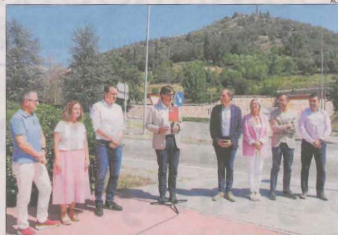
Illa a la Seu amb representants del PSC de Lleida.