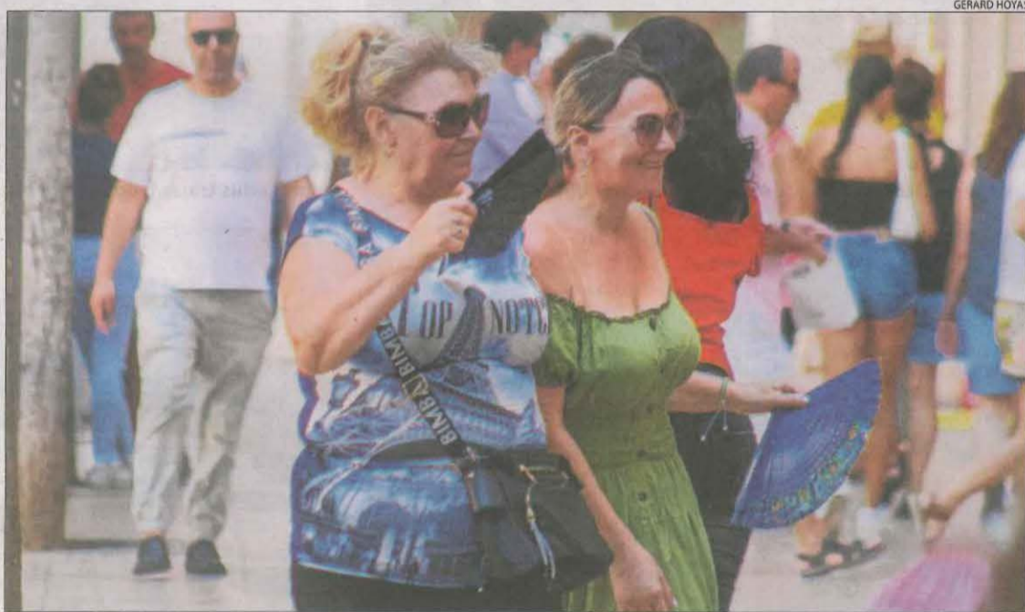
A Lleida, la Paeria extremarà avui la vigilància davant de la previsió de més calor.

La calor extrema també està afectant la campanya de la fruita. Agricultors del Pla d'Urgell, que ara es troben immersos en la recollida de la pera i la poma, asseguren que han avançat l'hora de sortir al camp. "Sortim al voltant de les 6 i les 7 del matí i tornem cap a les 12 o la una de la tarda perquè les temperatures són insuportables." "Intentem deixar per a última hora de la tarda els treballs que hagin quedat pendents", expliquen. Al Baix Segre, els agricultors van indicar que intenten adaptar-se als horaris dels temporers encara que "aconsellem treballar a primera hora del matí".