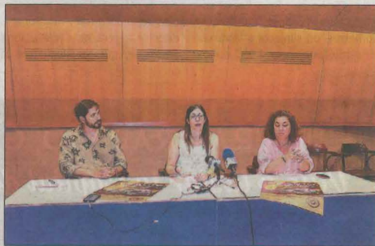
La nova edició de Firauto es va presentar ahir

Segons la Paeria, els concessionaris esperen aquestes fires que, de fet, són més pràctiques que vistoses, precisament perquè poden exposar els seus produc-