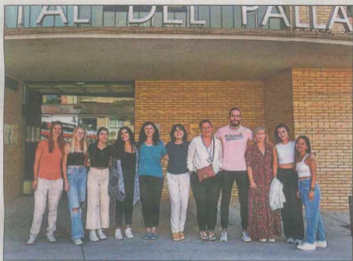
Els alumnes faran el curs sencer al Pirineu de Lleida

d'opcions, des de les més econòmiques, que es podran trobar al Mercat de la Ganga, amb vehicles de fins a 6.000 euros com màxim, fins a les més sofisticades, per a públics més exigents i els amants del motor.