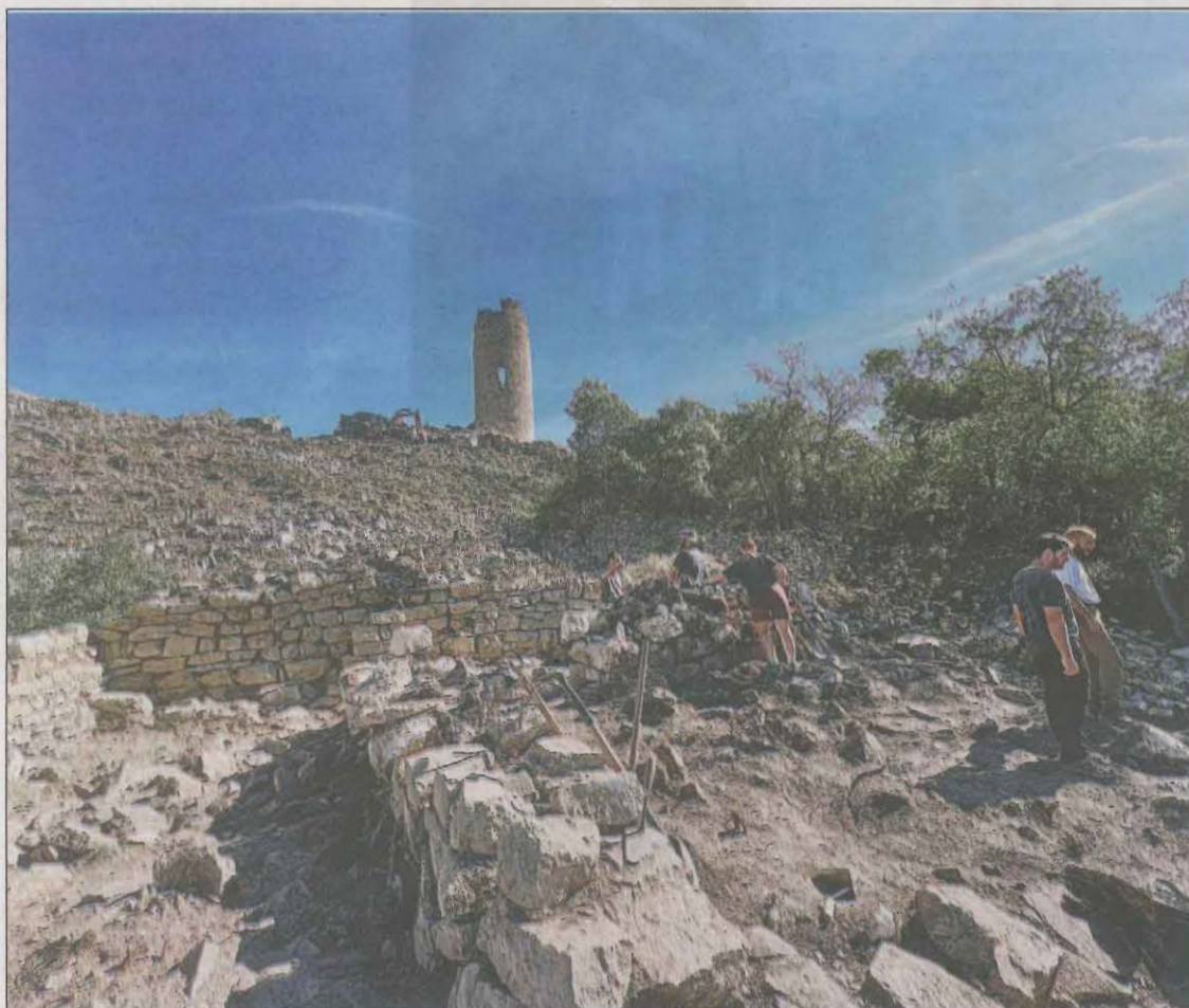
Murs d'una casa del poblat que s'està excavant a Sant Gervàs, al Pallars Jussà