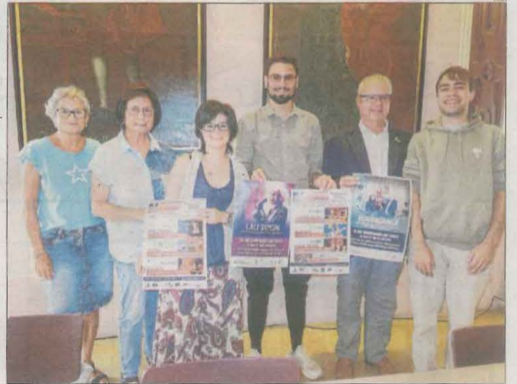
Imatge de la presentació del programa d'arts escèniques.