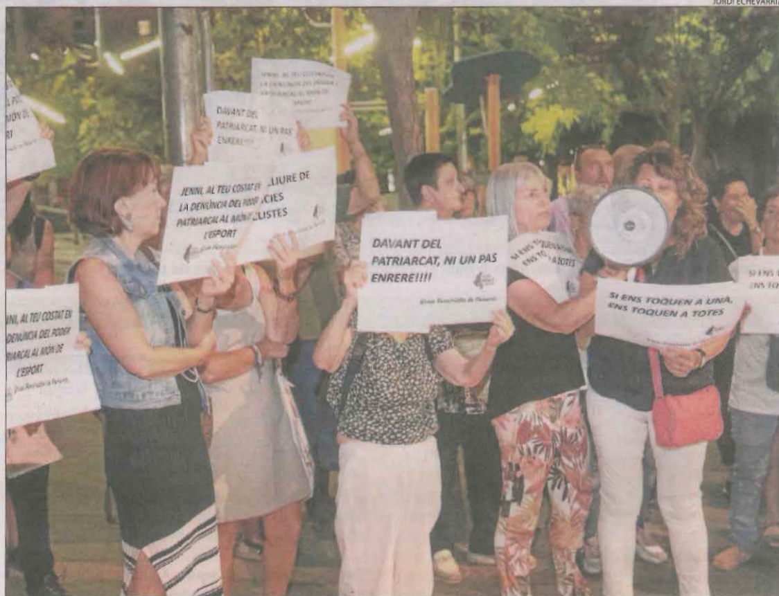
Dones que van assistir a la concentració porten pancartes amb lemes contra el masclisme.

Poc després va arribar el Grup Feminista de Ponent Do-