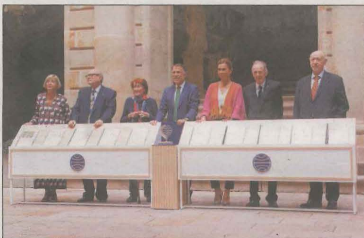
El jurat del Planeta va parlar ahir de les obres presentades