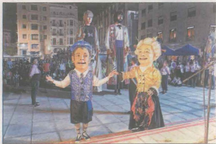
El Tràdius, el nou cappgròs del Grup Garrigues

La Tronada va servir també per presentar el Tràdius, un cappgròs que representa un jove lleidatà, fill de pares immigrants i vinculat a la cultura popular de la ciutat de Lleida.