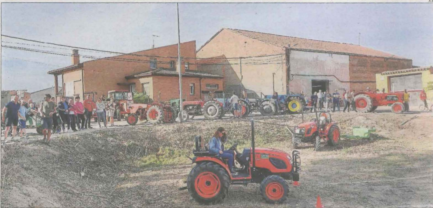
Un dels actes més freqüentats va ser la demostració de conducció de tractors amb una important presència femenina.