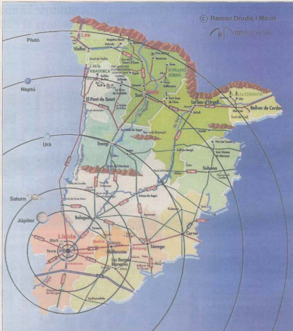
Òrbites a escala dels planetes del Sistema Solar sobre el mapa de les comarques de Lleida. RDM.

Per poder arribar a Mart, caldria utilitzar algun mitjà de transport, malgrat que si necessitem reduir la pressió arterial, el colesterol o el sucre del nostre organisme per indicació del metge, hi podríem arribar tot