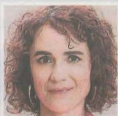
Consellera de Justícia de la Generalitat

«El silenci i l'oblit jurídic amb Companys són contraris als principis de justícia i reparació»