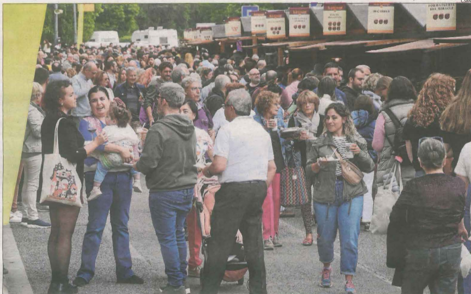
Milers de persones van degustar diferents varietats de formatges durant aquests tres dies a la Fira de Sant Ermengol de la Seu.

Algunes parades van tancar ahir a la tarda al quedar esgotades les seues existències, la qual cosa fa pressuposar que s'ha complert l'objectiu de vendre més de 6.000 quilos de formatge, cosa que comportaria una facturació de més de 150.000 euros en els tres dies que ha durat la fira.