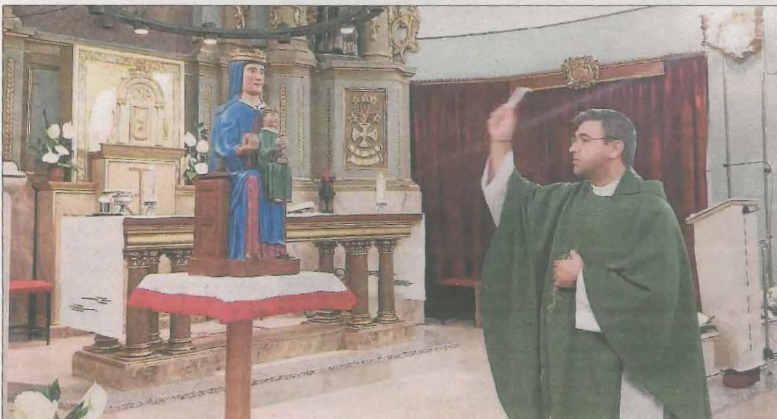
El moment de la benedicció ahir de la Mare de Déu d'Escarp.