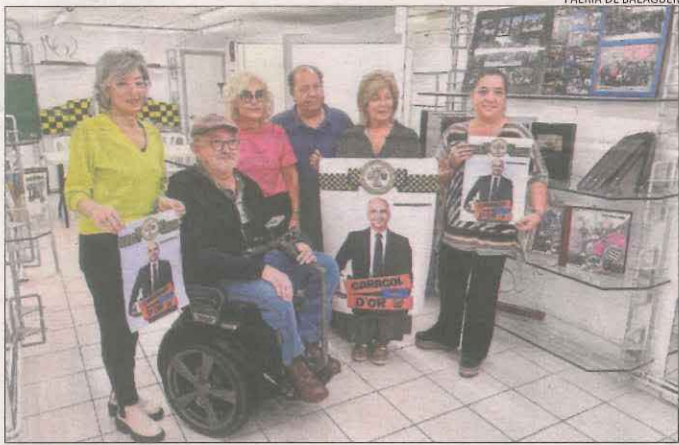
Presentació ahir de l'entrega que es farà el dia 29.