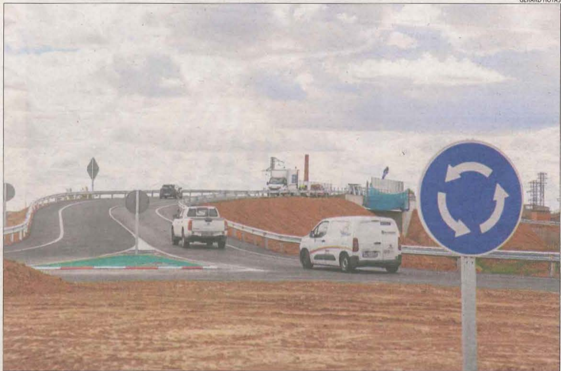
Els primers vehicles que ahir ja utilitzaven el pas elevat per evitar l'encreuament amb les vies.

L'alcalde de Tèrmens, Concepció Cañadell, va explicar que una vegada finalitzades les obres de supressió el tram urbà de la carretera C-13 hauria de ser municipal. "Entenem que la Generalitat ens traspasará aquest tram de carretera i