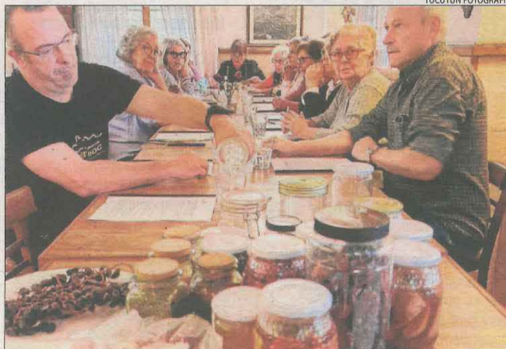
Els participants en el taller de conserves de productes naturals.