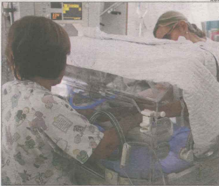
Imatge d'arxiu de la unitat de nounats a l'Arnau.

A les comarques lleidatanes, amb un 5,57% menys que l'any passat || Jan i Ona, els noms més comuns en nounats