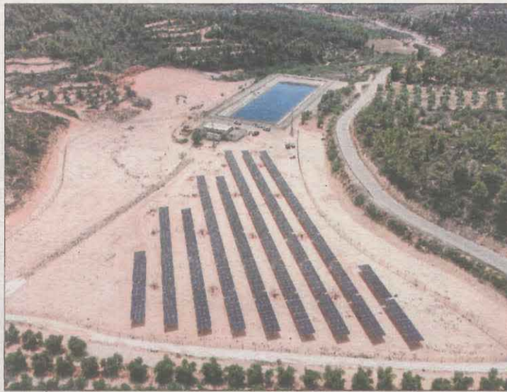
Panells solars del Garrigues Sud estrenats aquest any a Bovera.

En el conjunt de Catalunya, la Generalitat ha passat en dos anys de tenir autoritzats 9 MW