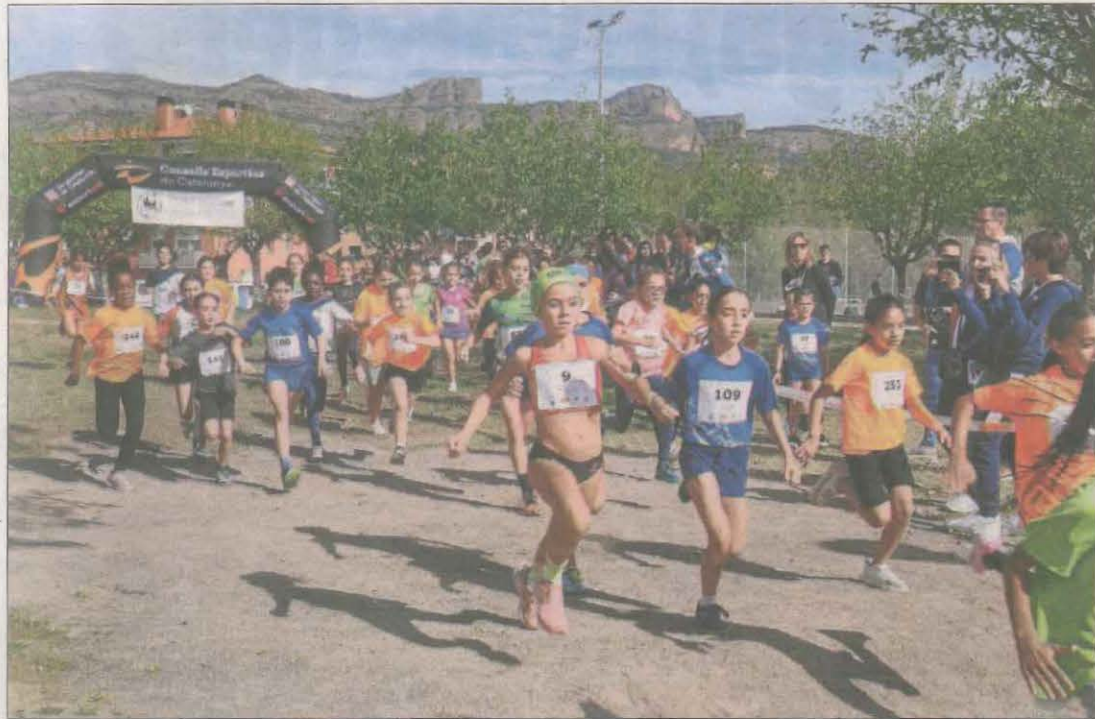
La sortida d'una de les categories escolars del Cros Intercomarcal de la Pobla.