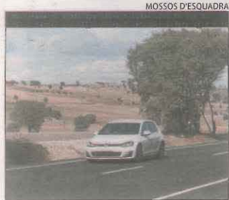
Imatge captada pel radar.

Un conductor de 54 anys als Plans de Sió