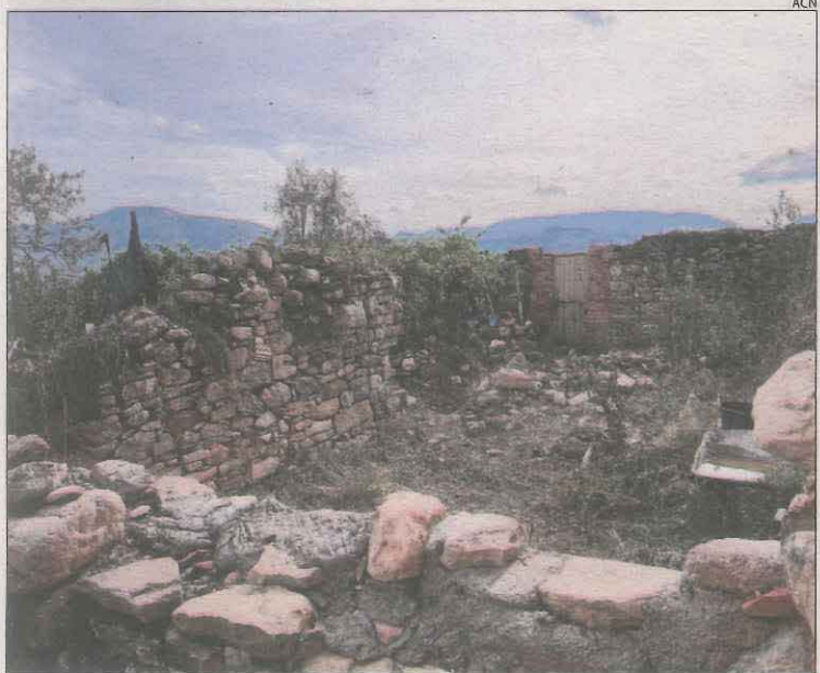
Imatge de la parcel·la on van trobar el cadàver.

D'altra banda, els Mossos d'Esquadra segueixen a l'espera dels resultats de les proves de l'ADN al cadàver localitzat en un hort. Si es confirmen les sospites, es tractaria d'una jove de 30 anys originària de l'àrea metropolitana de Barcelona però que feia anys que residia al Pirineu lleidatà.