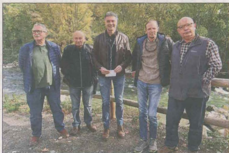
Representants de les associacions i entitats de pescadors

Volent fomentar la pràctica esportiva de la pesca i treballar pel desenvolupament i conservació