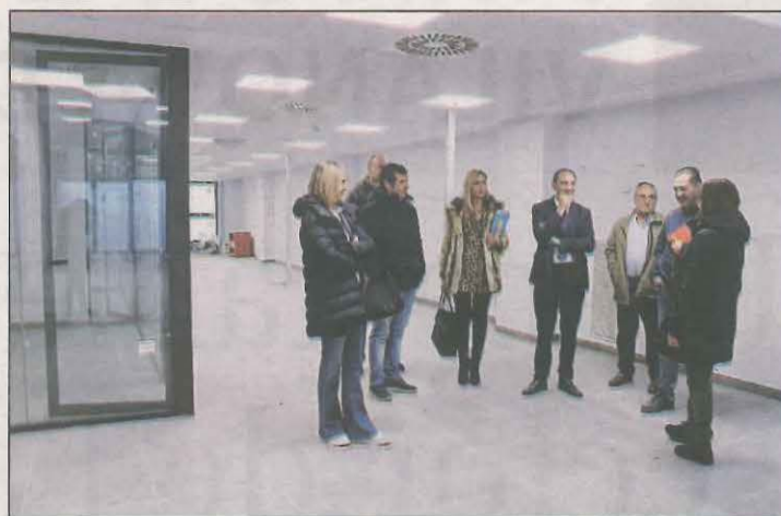
Moment en què el subdelegat va visitar les instal·lacions

La capital de l'Urgell també dedicarà una mica més d'1 milió d'euros a l'amortització de deute bancari i interessos. Així, es preveu finalitzar l'exercici 2024 amb un 23,11% de nivell d'endeutament ajustant-se a la normativa financera.