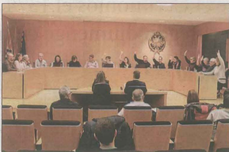
Moment de la votació al ple de Tàrrega

Quant a la preservació de patrimoni destaca la conservació dels torricons del Parc de Sant Eloi, l'adquisició de Cal Calçada vora la futura casa museu de Ma-