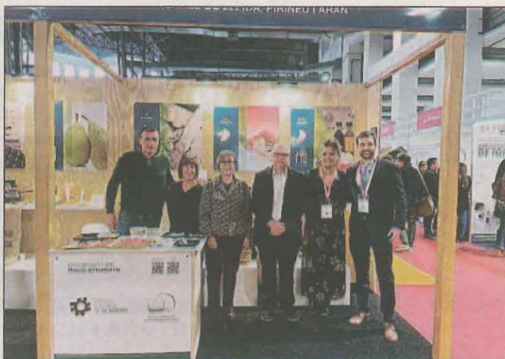
Imatge de l'estand del Consell Comarcal de la Segarra

la cèntrica Rambla Doctor Pearson 34 que finança el Ministeri de Treball i Economia Social. El pressupost d'aquesta actuació és de 324.000 euros.