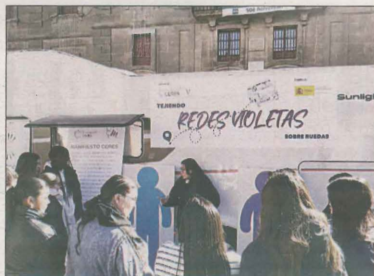
Alguns dels joves que van participar en l'activitat

La plaça Universitat de Cervera va acollir ahir l'autocaravana de la ruta itinerant que efectua el projecte Teixint Xarxes Violetes per a la prevenció de les diferents formes de violència contra les dones. Es van dur a terme un total de quatre activitats que van comptar amb la participació de més de 150 joves d'entre 16 i 18 anys del municipi.