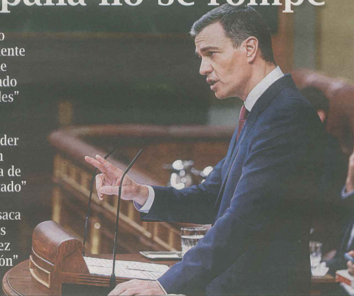
Pedro Sánchez se dirige a los diputados para pedir su confianza y poder revalidar hoy su mandato en la Moncloa | PÁG. 3-7

► Esquerra saca pecho y Junts afea a Sánchez llamar "perdón" a la amnistía