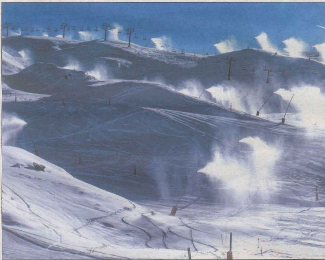
Imatge d'arxiu de l'estació de Baqueira-Beret amb els canons de neu a ple rendiment

Aquesta partida beneficiava les estacions de Baqueira-Beret, el Port del Comte i Masella. L'any 2021, però, també es va incloure Tavascan, una estació de titularitat municipal. Segons van explicar des de Tavascan, la mesura no els afectarà perquè el projecte que van presentar per concórrer a la convocatòria ja havia superat tots els passos fins a l'aprovació final. En el moment en què es va fer pública la notícia, els responsables de l'estació no sabien si la decisió del Govern