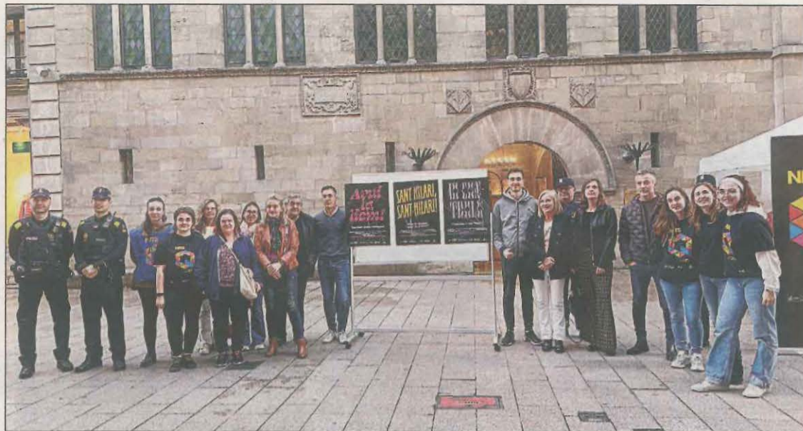
Joves i autoritats locals presenten la campanya contra l'alcoholisme a la plaça de la Paeria