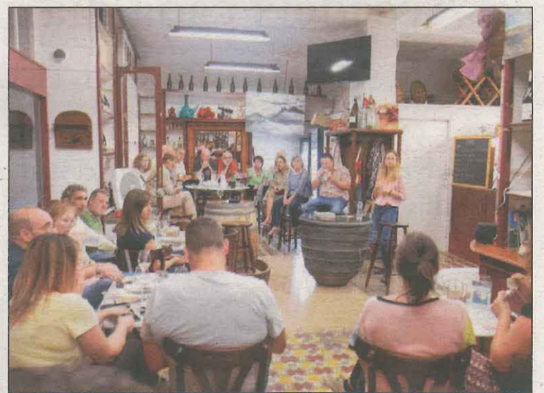
Algunes de les persones participants en el festival

Pel que respecta a l'oferta cultural del festival, s'han programat espectacles en entorns tan diversos com vinyes, places o miradors. L'edició també va comptar amb músics com Itsasgorak, Guillem Roma o la banda Koko-Jean & the Tonics i també van tenir lloc altres propostes còmiques, de màgia i dansa, així com dues peces de microteatre. El colofó final va ser el Sopar de l'Oli, que va tenir els olis d'oliva verge extra de la comarca del Pallars com a protagonistes.