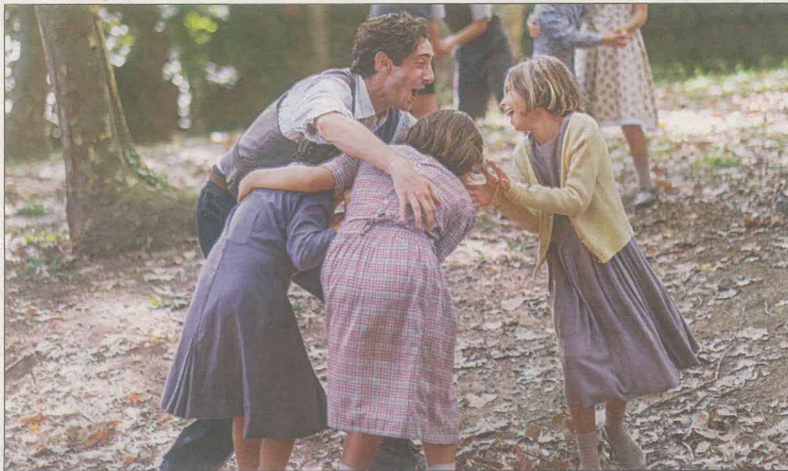
La pel·lícula dirigida per Patricia Font narra la història del mestre Antoni Benaiges