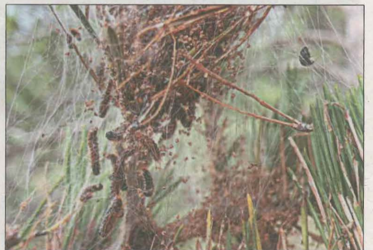
Un exemple de processionària de pi

La major part dels tractaments, gairebé un 90%, se cen-